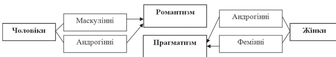
Рис. 2. Стереотипи любовних стосунків учасників дослідження за статевими та гендерними ознаками

Представимо результати дослідження у вигляді схеми (рис. 2).