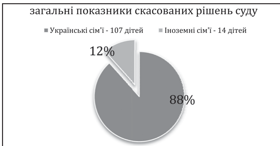
Мал. 2. Тенденції скасування рішень суду про усиновлення дітей з України

Аналіз статистичних даних останніх років та випадків в нашому дослідженні, де мали місце скасування усиновлення/удочеріння, показав їх перевагу при національному усиновленні/удочерінні, ніж в ситуації міждержавного. Цей факт може бути пов'язаний, як із більш ретельною підготовкою громадян до прийняття в свою сім'ю некровної дитини, так і політикою відкритого усиновлення/удочеріння, що більш поширена в інших країнах, зокрема в США, Італії, Іспанії, Франції (мал. 2).