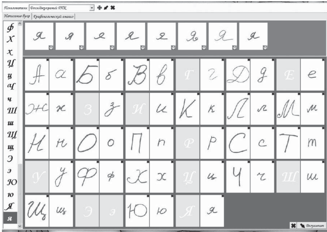
Рис. 2. Аналіз характеру букв

інтервал між словами, впорядковані поля зліва і справа, використання друкованих букв, висока варіативність у написанні букв, маленька ширина петель у буквах “в”, “у”, “д”, “з”, деякі літери ледве намічені (зокрема “ь”, “ч”).