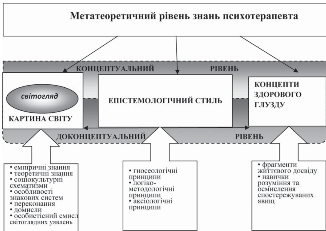
Рис. 1. Модель метатеоретичного рівня знань психотерапевта

Ознайомлення із філософськими джерелами, що стосуються метатеоретичного рівня знання, та психологічними працями, що аналізують специфіку та ефективність професійної діяльності психотерапевта, дає можливість представити модель метатеоретичного знання психотерапевта, яке включає три найважливіші компоненти: картину світу, епістемологічний стиль та концепти здорового глузду (рис. 1).