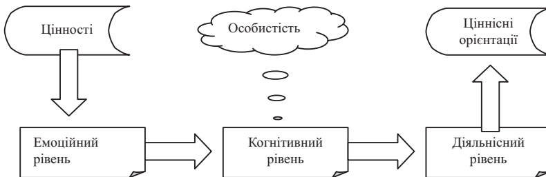
Мал. 2. Схема особистісного аксіогенезу (за В.Ю. Дмитрієвим)

Цінність досягається людиною одразу на емоційному рівні (викликає позитивні емоції при міжособистісній взаємодії), тоді сприймається на когнітивному (осмислення важливості у соціальних транзакціях), підтверджується при особистому застосуванні (діяльнісний рівень), і тільки після цього засвоюється особистістю, стає її ціннісною орієнтацією (див. мал.2).