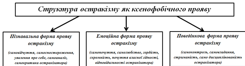
Рис. 2. Структура остракізму в контексті прояву ксенофобії

Упередження розглядається як негативна установка щодо певних груп осіб, що актуалізується в ситуації загрози власній групі, форма відображення та оцінки, яка характеризується негативним емоційним зарядом і відповідає таким формам поведінки, як уникнення спілкування або ухилення від контактів у певних сферах життєдіяльності. Г. Олпорт виокремлює історичні, економічні, соціокультурні, ситуаційні, психогенні, феноменологічні типи упереджень, стверджуючи, що всі вони здатні за певних умов породжувати прояви ворожості, що засвідчує актуалізацію остракізаторських тенденцій (Олпорт, 2002; Трофимова, 2009).