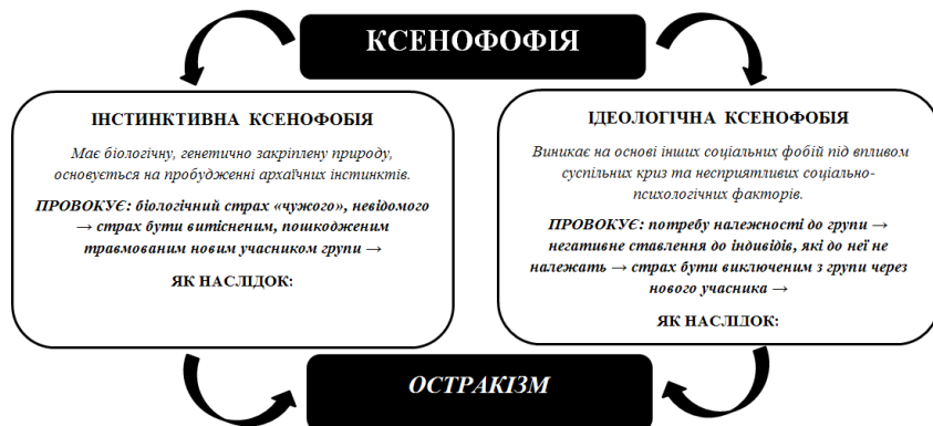
Рис. 1. Основні критерії генезису ксенофобії, їх зв'язок з остракізмом

іншої людини й оцінювала б її перш за все як особистість, а не частину певної групи. Це дає підставу розглядати такі особистісні прояви (упередження, стереотипи, соціальні установки) як передпричини остракізму (Кроз, 2005).