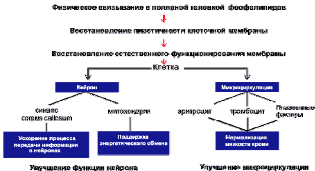
Рис. 2. Механизмы развития нейротропного и вазотропного эффектов пирацетама

Безусловно значимым является свойственный пирацетаму сосудистый компонент действия (рис. 2). Этот базовый рацетам угнетает агрегацию тромбоцитов, ослабляет их адгезивные свойства в отношении эпителия стенки кровеносных сосудов, уменьшает вязкость плазмы и цельной крови, а также редуцирует спастическую реакцию гладких мышц сосудистой стенки [7, 10, 21]: