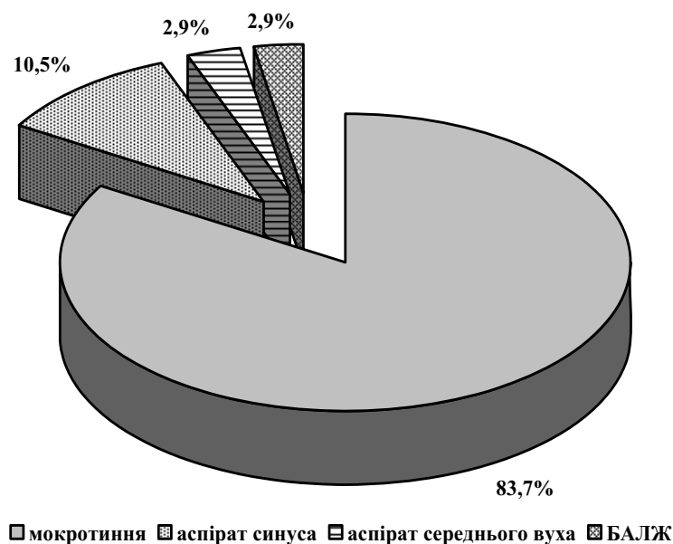
Рис. 1. Види досліджуваного матеріалу

Поєднання двох етіологічно вагомих збудників S. pneumoniae та H. influenzae спостерігалось у 8% пацієнтів зі 143 осіб, що були включені в дослідження. Поєднання мікроорганізмів визначалося частіше у пацієнтів з діагнозом синуситу, що було виявлено в 3 випадках.