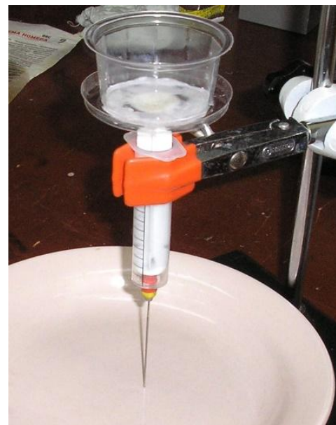
Рис.5. Прибор для экспресс-контроля показателя пенетрации облученных продуктов

задачи – получения нужных структурно-механических показателей продукта, но минимальной с точки зрения приемлемости этого процесса по органолептическим характеристикам и экономическим соображениям. Как следует из табл.1, увеличение дозы приводит к повышению стоимости обработки, так как потребует увеличения реального времени работы технологической линии. Потому методика исследований была построена на принципах последовательного повышения поглощенной дозы, до момента достижения необходимых свойств мышечной ткани обрабатываемых моллюсков. В качестве характеризующего параметра был выбран показатель пенетрации. Специально для данных исследований был создан прибор для экспресс-контроля данного показателя и динамики его изменения (рис. 5).