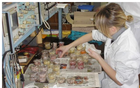
Рис.6. Процесс подготовки образцов к электронной обработке в препаровочном помещении установки.

С помощью созданного прибора производились экспресс замеры степени изменения консистенции мышечной ткани моллюсков (рис. 7).