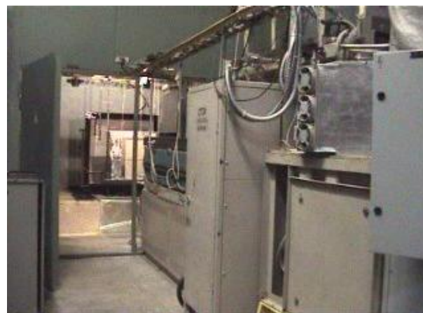
Рис.1. – Универсальная экспериментальная установка ИЯИ НАН Украины для исследований и разработки пиковолновых технологий (Освещена реакционная камера, где осуществляется воздействие электронов на материал).

Электронная обработка осуществлялась на экспериментальной базе ИЯИ НАН Украины (рис. 1.) [3].