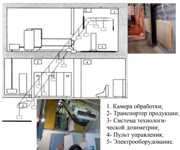
Рис.2. Схема технологической линии электронной обработки пищевых продуктов

ускоритель и его вспомогательное оборудование. Подача образцов под электронную обработку осуществляется многофункциональным операционным конвейером (2). Конвейер устроен таким образом, что обеспечивает за один проход обработку продукции с обеих сторон. Это обеспечивает высокую эффективность передачи энергии электронов во внутрь продукции и производительность установки.