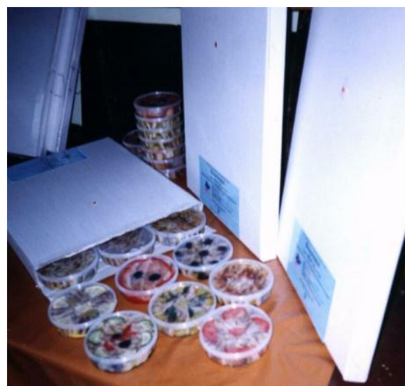
Рис.3. Исследуемые образцы, в герметичных упаковках, в транспортных планшетах.