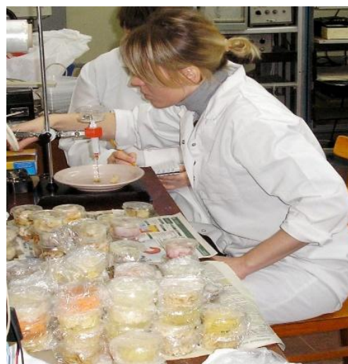
Рис.7. Экспресс анализ результатов пиковолновой обработки

Экспериментальные данные обрабатывали методами математической статистики [12], их достоверность устанавливали с помощью критерия Стьюдента (t-критерий) при доверительной вероятности \geq 0,95 и количестве параллельных определений не менее 5. Для обработки полученных результатов и построения графических зависимостей использовали – Microsoft Office Excel 2013.