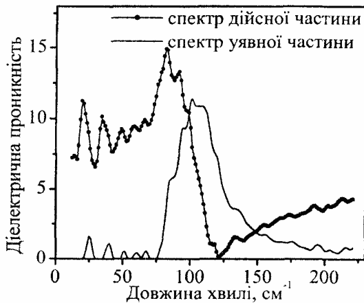
Рис. 3. Спектри дійсної і уявної частин діелектричної проникності кристала 4H\text{-CdI}_2 .

Розв'язок цієї задачі можна отримати з допомогою співвідношень Крамерса-Кроніга [3] або на основі моделі невзаємодіючих дисперсійних осциляторів [4]. На рис. 3 зображено спектри дійсної і уявної частин комплексної діелектричної проникності кристала 4H\text{-CdI}_2 , обчислені за допомогою співвідношень Крамерса-Кроніга. Частоти поперечних і поздовжніх оптичних фононів визначалися з положень максимумів функцій відповідно \text{Im} \varepsilon^*(\omega) і \text{Im}(-\varepsilon^*(\omega))^{-1} , а півширини максимумів цих функцій несуть у собі інформацію про коефіцієнти загасання оптичних фононів \gamma_i, \gamma_i [5]. Крім того, абсолютні значення функцій \text{Im} \varepsilon^*(\omega_i) і \text{Im}(-\varepsilon^*(\omega_i))^{-1} дозволяють знайти сили осциляторів S_i і S_i фононів [5]. Числові значення параметрів основних коливних осциляторів кристала 4H\text{-CdI}_2 наведено в табл. 1.