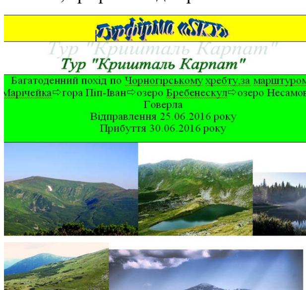
Рис. 2. Фрагмент рекламної пропозиції віртуальної туристичної фірми.

накладні, рахунки, рекламні пропозиції (рис. 2), розрахунки вартості путівок, шаблони, створювались макроси автоматизованої побудови типових форм, візитки (рис. 3), блок-схеми, графіки та діаграми.