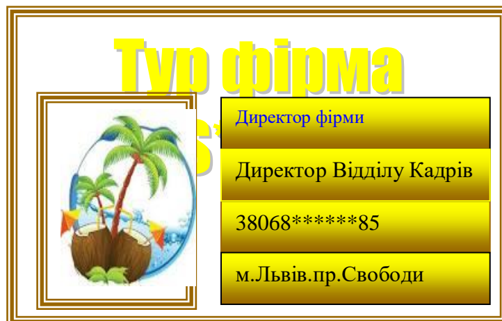
Рис. 3. Візитка для віртуальної туристичної фірми.

Для створення віртуальної туристичної фірми застосовувались такі технології MS Word: створення та форматування документів; використання колекції малюнків; використання панелі інструментів “Малювання”; використання редактора формул; побудова організаційних діаграм; вставка об'єктів з екрана монітора; побудова графіків; виконання розрахунків в таблицях; створення електронних форм документів; автоматизація виконання обчислень; робота з таблицями; імпорт із СУБД Access, Інтернету, табличного процесора Excel та інше.