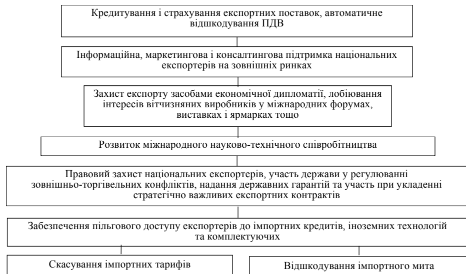
Рис. 4. Механізми державного захисту національних експортерів

Недоліком є те, що інші країни прагнуть накладати протекціоністські перепони на вітчизняну промисловий експорт. Якщо раніше зазвичай практикувалось накладання високих тарифних ставок на імпорт, то сьогодні, в умовах членства в СОТ, широко застосовуються технічні бар'єри (фітосанітарні та екологічні вимоги, антидемпінгові розслідування, вимоги до пакування та маркування тощо), не виключені також і прямі заборони.