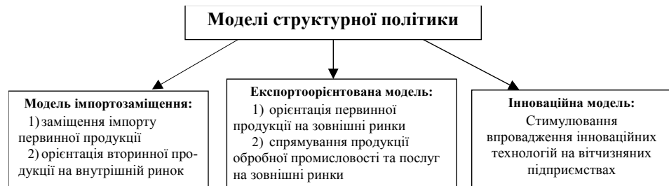
Рис. 3. Моделі структурної політики

1. Модель імпортозаміщення базується на стимулюванні внутрішнього виробництва та послабленні зовнішнього конкурентного тиску шляхом протекціоністських заходів. Першими, хто визнавав доцільність протекціонізму як дієвого методу для забезпечення економічного розвитку країни, були меркантилісти: Т. Мен («Багатство Англії у зовнішній торгівлі») і Ф. Ліст («Національна система політичної економії»). Різновидами моделі є: політика орієнтації первинної або вторинної продукції на внутрішній ринок. На практиці ця модель реалізується шляхом створення спільних підприємств із іноземними компаніями, яких приваблює виробництво під захистом митних і податкових пільг.