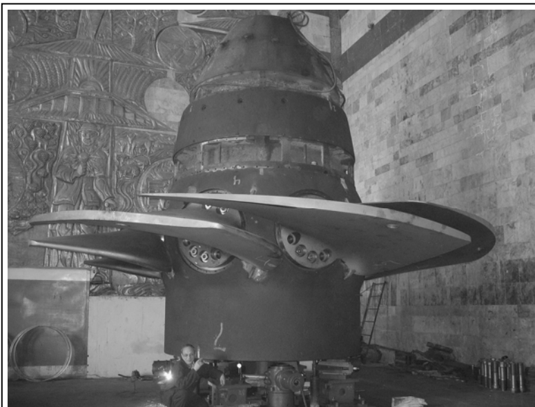
Рис. 3. Рабочее колесо Шамкирской ГЭС, Азербайджан