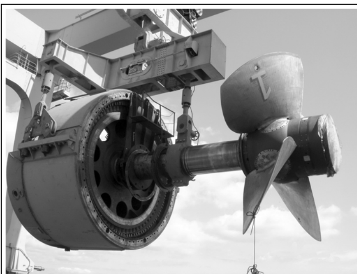
Рис. 1. Монтаж роторной части гидроагрегата Каневской ГЭС, Украина

В настоящее время ОАО «Турбоатом» изготавливаются две гидравлические турбины со встроенным кольцевым затвором для ГЭС Ла Йеска (Мексика) (максимальная мощность турбины 426,13 МВт, максимальный напор 186,7 м, диаметр рабочего колеса 5,3 м). Максимальное значение КПД модели составило 94,0% (в пересчете на натуру максимальное значение КПД будет 96,02%). Средневзвешенный КПД составил 95,72%. Благодаря высокому уровню украинских гидротурбин в данном классе в тендерных торгах по ГЭС Ла Йеска ОАО «Турбоатом» сумело опередить такие известные фирмы, как «VOITH SIEMENS», «ALSTOM», «VA TECH HYDRO».