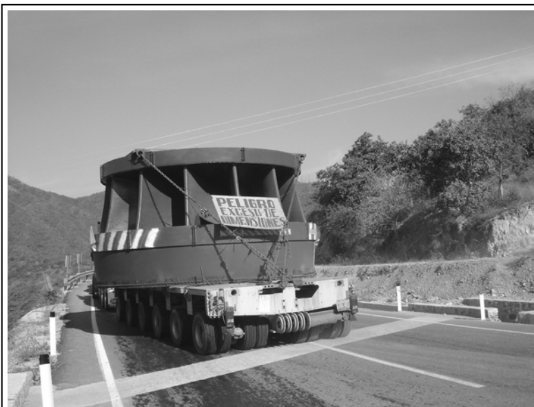
Рис. 4. Транспортировка рабочего колеса на стройплощадку ГЭС Эль Кахон, Мексика

Сооружаемая в настоящее время Днестровская ГАЭС (рис. 5) комплектуется семью обратимыми гидромашинными, максимальная единичная мощность гидромашин в турбинном режиме составляет 390,0, в насосном режиме 420,0 МВт. Максимальный КПД (по данным модельных испытаний при пересчете на прототип) составляет соответственно 93,5 и 92,8%.