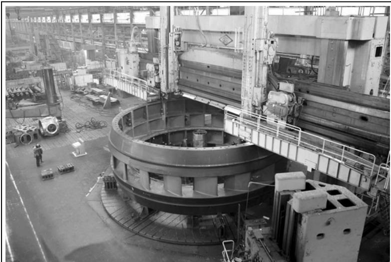
Рис. 5. Обработка статора гидромашины Днестровской ГАЭС, Украина

на совершенно другой уровень и экспериментальные исследования. В соответствии с международной практикой приёмсдаточные испытания модели являются одной из основ для определения энергокавитационных качеств разрабатываемых конструкций гидротурбин. На сегодняшний день ни один контракт на поставку крупных гидротурбин не обходится без приёмсдаточных модельных исследований, которые дают возможность наиболее точно оценить и прогнозировать характеристики натуральных гидромашин (прототип). Они предполагают наличие у поставщика гидротурбинного оборудования гидравлических энергокавитационных стендов, соответствующих стандарту ИЕС 60193 и прошедших сертификацию.