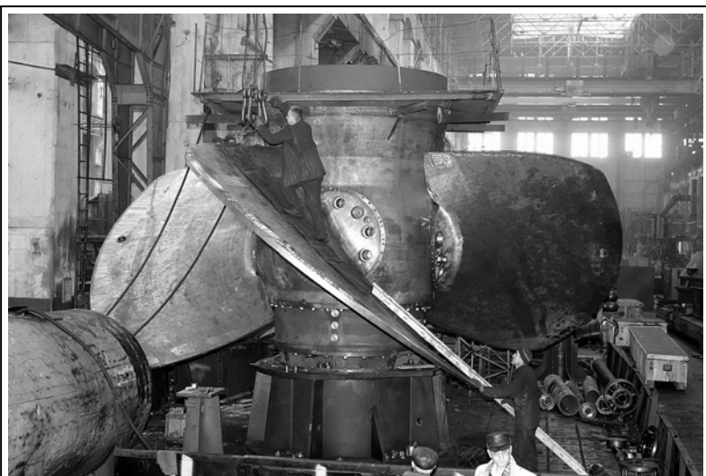
Рис. 7. Контрольная сборка рабочего колеса Каховской ГЭС, Украина

В соответствии с принятой Программой реконструкции ГЭС Днепровского каскада работы по реабилитации гидроэлектростанций были поделены на два этапа. В результате реализации I этапа (завершен в 2002 г.) для трех ГЭС каскада было поставлено 18 комплек-