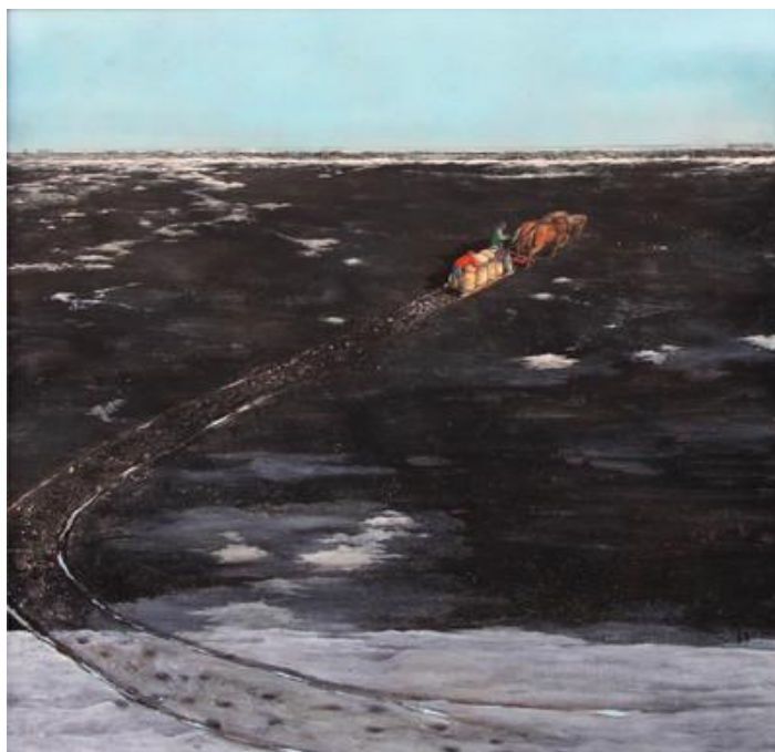
Рис. 2. Курилик В. Земля тяжким горем так сильно засіяна. 1970 р. Олія, панель, 120x120. Приватна колекція. URL : https://www.mayberryfineart.com/artwork/X29-57E-193

твір «Земля тяжким горем так сильно засіяна» (1970), що показує безкраї канадські чорноземи, на тлі яких батько із сином і парою коней провадять щоденну працю.