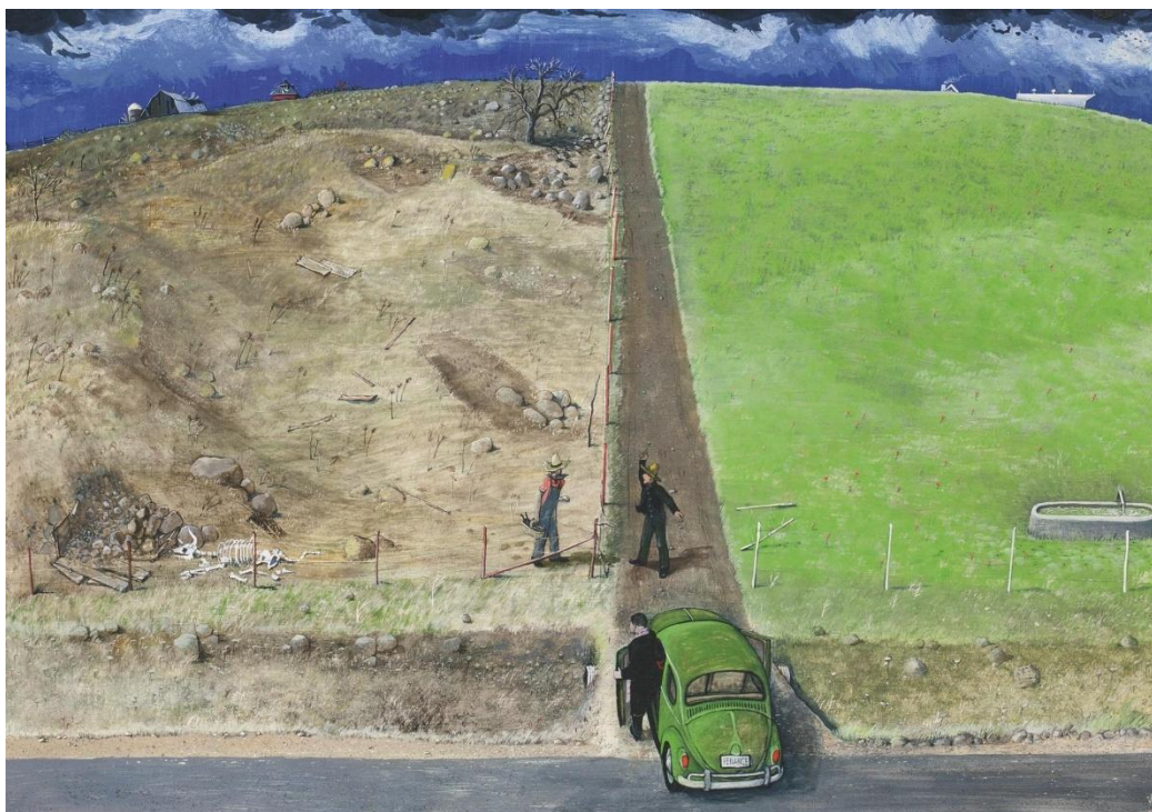
Рис. 3. Курилик В. Таїнство покаяння. Мішана техніка, дошка. 61 x 61 см. Приватна колекція. URL : http://www.sothebys.com/fr/auctions/ecatalogue/lot.19.html/2012/null-t00141

Трагізм братонищення втілений у картині «Він ненавидить наш скептицизм» (1972), де художник посеред нічного мегаполіса розгортає жовтогаряче пшеничне поле, обтяжене щедрим урожаєм полонених тіл і душ, усяєне людиноподібним колоссям, по якому мчить трактор, яким керує чорт в образі заможного фермера. Другорядні персонажі (снопи зі скошених людських тіл) слугують для увиразнення характеру головної особи. У цих численних постатях втілені різні світогляди, альтернативні до центрального персонажа твору. Цей твір є своєрідною сагою про щасливий добробут ціною втрат морально-духовних цінностей. У сюжеті помітні й релігійні конотації — батько як невірний Фома, який картає себе через релігійну «перверсію», переживаючи самотність на тлі непростого вибору своєї долі.