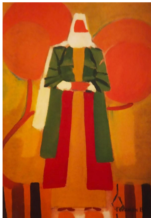
Рис. 2. В. Гегамян «Вірменія», 1970-ті рр., картон, олія, 295x210 мм

підняті догори, де усе підпорядковане статиці та відстороненню, не можна не згадати про ще одне захоплення автора – візантійським мистецтвом, бо паралель з Орантою в даному випадку є очевидною. Варто підкреслити цікаву рису – лише в одному випадку, саме в картоні «Вірменія», композиційне рішення побудоване за принципами симетрії, в інших домінує асиметричний принцип, що є, очевидно, не випадковим – центральна вісь композиції навмисно зміщена вбік, усюди – ліворуч. Лише картон «Вірменія» має головну композиційну вісь, власне постать, чітко посередині композиції. Це додає роботі статичності, монументальності та величі.