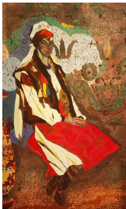
Рис. 4. В. Гегамян «Українка», кін. 1960-х рр., полотно, олія, 2555x1685 мм

Висновки. Звернення до етнічних образів, ретельне дослідження, майже препарування національних характерів – завдання, яке ставив перед собою Валерій Гегамян впродовж усього творчого життя. Він передавав національний колорит кольором, ритмікою, формою, вивчаючи вбрання, особливості обличчя, розташовуючи образ у певному середовищі – чи то архітектурному тлі, чи фрагментах пейзажу. Щоразу він був здатен зафіксувати найхарактерніше, неповторне саме для обраного образу, зробивши його впізнаваним, гострим та унікальним. Але кожний з корпусів етнічних образів пензля художника, чи то вірменські, чи українські, чи російські мотиви, варті дослідження та розширеного аналізу, бо до сьогодні ця тема може вважатися однією з лакун вітчизняного мистецтвознавства. Загалом можна відзначити, що тематика робіт, а саме звернення до національних особливостей не є ключовою для творчості нонконформістів. А притаманна Валерію