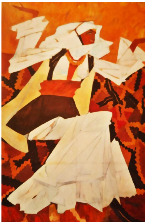
Рис. 1. В. Гегамян «Вірменська танцівниця», 1970-ті рр., картон, олія, 2545x1655 мм

нятими руками («Вірменин з двома глеками», 1970-ті рр., картон, олія, 295x210 мм). Але, дивлячись на картони з жіночими образами, руки яких