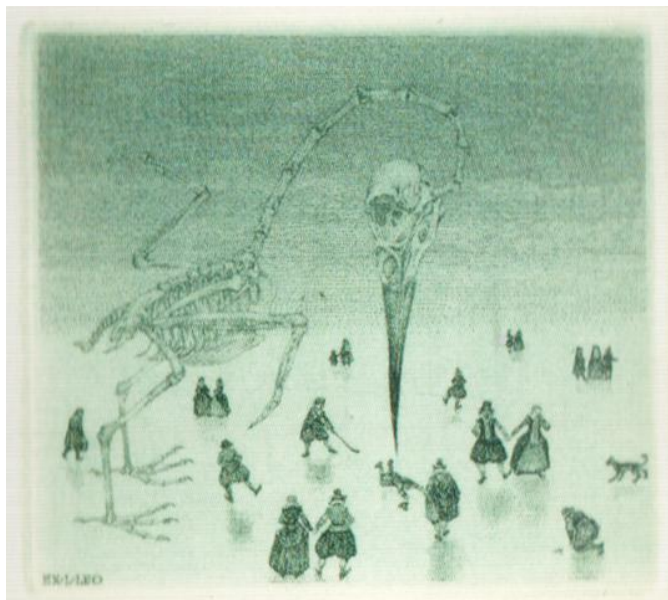
Рис.1. Автор: К. Калинович., «The White bird», техніка: офорт (С3), 2010

Зазвичай розмір екслібриса не має перевищувати 15 см. Доволі важке завдання постає перед художником, коли треба вписуватись у стислі рамки, проте це не є складністю для справжнього майстра своєї справи, яким є К. Калинович. Його екслібриси за сюжетом та подачею чимось нагадують твори нідерландських митців. Його мініатюри інколи виглядають досить динамічно, як от його екслібрис «The White bird» (рис. 1).