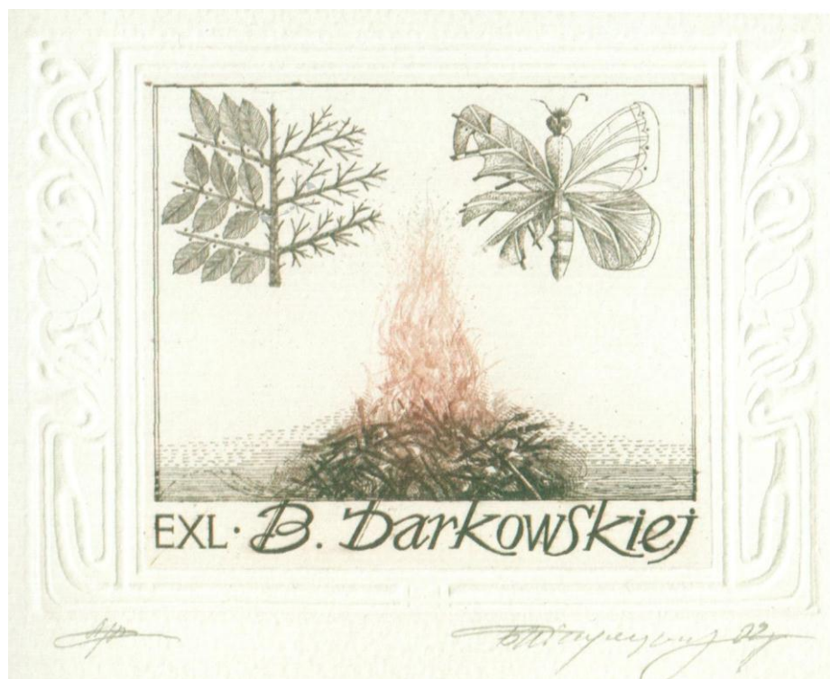
Рис.2. Автор: Б. Пікулуцький, "Exl. B. Darkowskiej", техніка: офорт (С3), 2012

Окрім майстерно зробленого екслібриса, робота по краях аркуша прикрашена сліпим тисненням на папері у вигляді лаконічного рослинного орнаменту, яке творить імпровізовану раму для графічної роботи. Під екслібрисом витиснений львівський герб. Робота виглядає елегантно, і очевидно, що вона більше підходить для колекційного зберігання, ніж як традиційного екслібриса, який вклеєно у книгу.