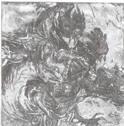
Рис.4. Автор: Р. Агірба, “Battle of roosters”, техніка: офорт (С3, С2), 2015

Його екслібриси носять символічний характер, часто він звертається до міфології. А от його робота «Битва півнів», яка була представлена на брестській виставці у 2015 р.– це фактурний твір, в якому доволі темний тон зображення виділяє несподівані форми, плавні лінії та текстурні елементи в композиції (рис. 4).