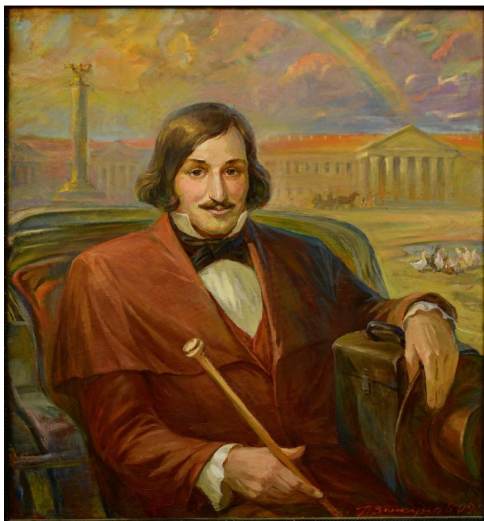
Мал. 7. «Веселка над Полтавою», 110x100, н/о, 2016 р.