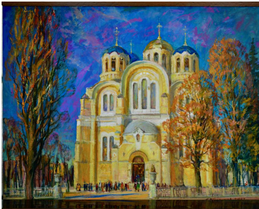
Мал. 2. «Володимир Великий», 120x110, н/о, 2011 р.

На іншій зображено найвідоміший з християнських святинь – Володимирський кафедральний патріарший собор (Мал 2.).