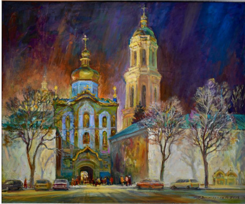
Мал. 1. Свят вечір, 120x135, н/о, 2013 р.

На іншій зображено найвідоміший з християнських святинь – Володимирський кафедральний патріарший собор (Мал 2.).