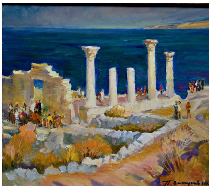
Мал. 4. Херсонес, 60x80, н/о, 2011 р.