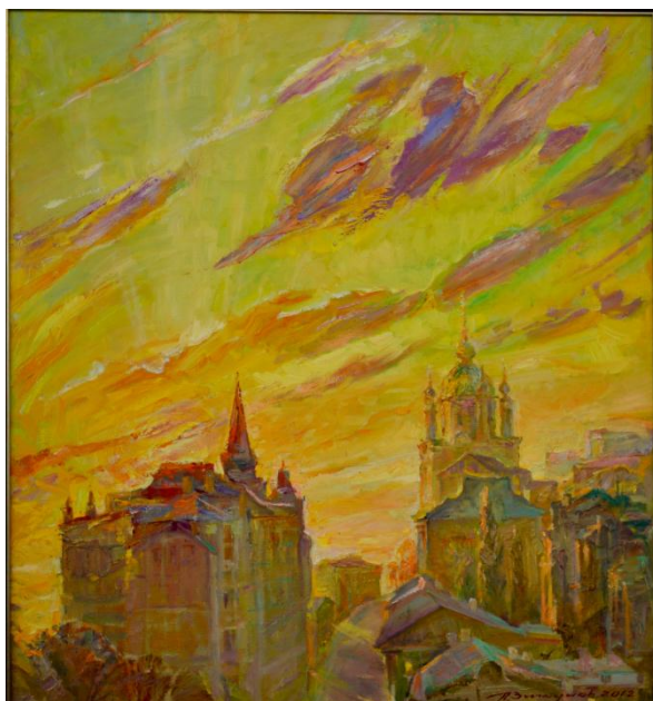
Мал. 3. Ранкове золото, 120x110, н/о, 2016 р.

Петро Зикунів кілька разів бував на пленерах у Криму, де милувався красою Бахчисарая, Херсонеса, Інкермана, Севастополя. Після цих поїздок з'явилося чимало робіт, частина з яких представлена на цій виставці. Як зізнався художник, йому дуже болить тема Криму і він вірить, що прийде той час, коли півострів повернеться до України (мал. 4).