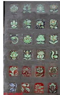
Рис. 2. Н. Федорова. Розписні плитки. 1970. Шамот, поливи, емалі. 218x80. Київ, вул. А. Солов'яненка, 16

Привертає увагу колірна гама шостої стіни. Чотири верхні ряди плиток – світло-зелені, а два нижні з зеленими квітками на насиченому вишневому фоні, чітко обрамлені темно-брунатною лінією, у деяких відсутні всередині орнаментальні елементи, тому вони метричні (рис. 2).