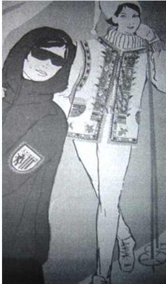
Рис. 4. Спортивний костюм. Автор Ф. Алексєєнко

«горбаткою», із вишивкою з орнаментом елементів килимів Західної України (техніка «низь»), що пролягала попереду спідниці вздовж відділюваного шва (рис. 3) [3, 25].