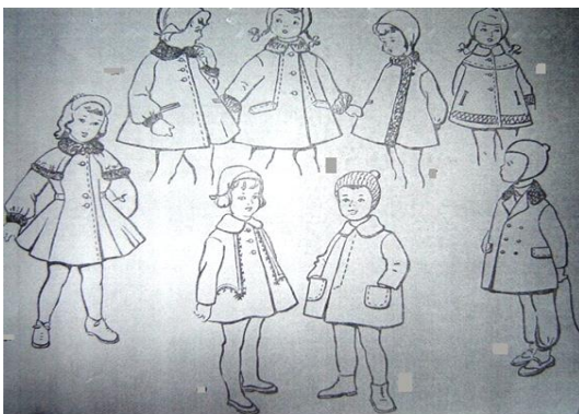
Рис. 2, а. Демісезонний одяг 60-х рр. XX ст.