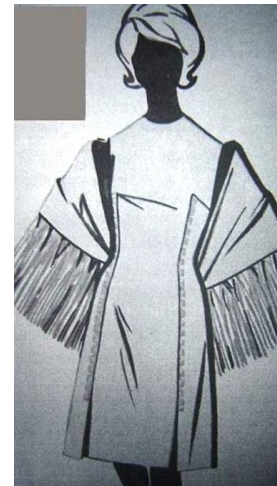
Рис. 2, б. Демісезонний одяг 60-х рр. XX ст.