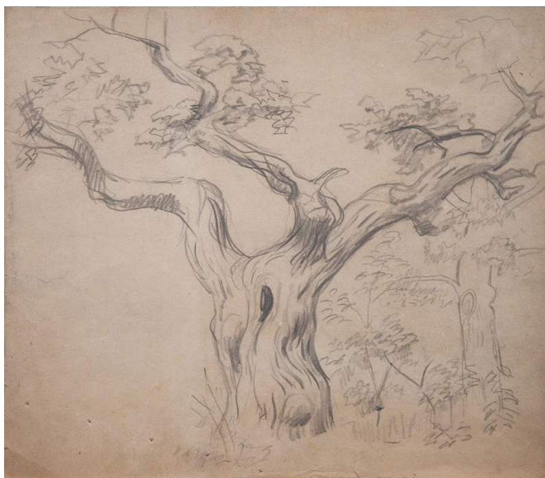
Рис. 4. М. І. Сапожников. «Дерево». Папір, олівець, 33×37,5 см. Збірка Дніпровського художнього музею