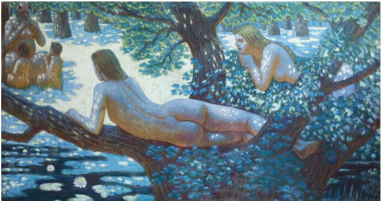
Рис. 3. М. І. Сапожников. «Пісня сопілки». 1918–1924. Полотно, клейові фарби, 100,5×188,5 см. Збірка Дніпровського художнього музею