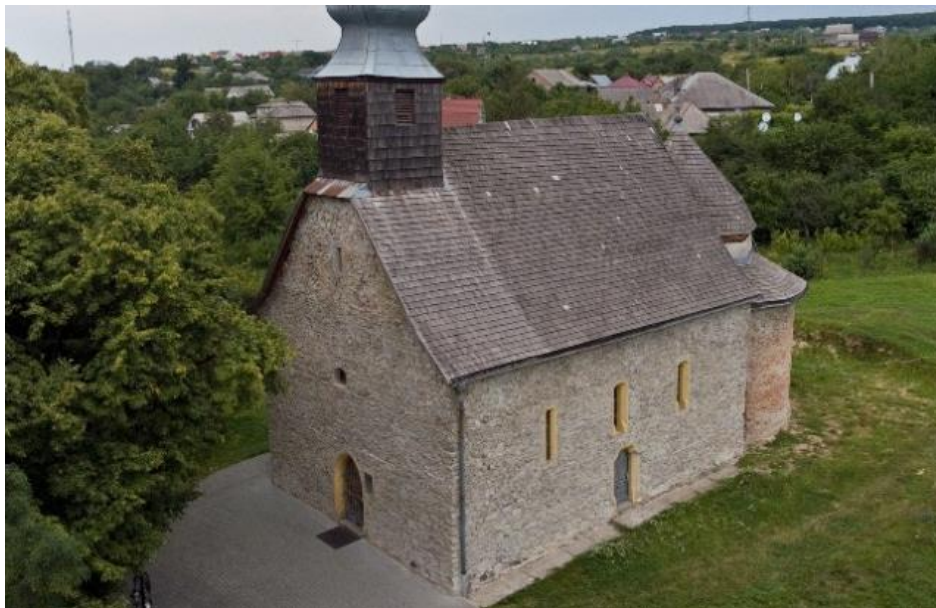
Рис. 2. Горянська ротонда

втратив узагальненість форми, лінія сумлінно обрисовує деталі, зупиняючись однаково як на головному, так і на дрібницях. У «Розп'ятті» особливо вражає знепритомніла Марія, з омертвіло обвислими руками. Персонажі «Розп'яття» і «Покрови» відзначаються внутрішньою, майже фанатичною зосередженістю, в них відсутній м'який ліризм, який так підкупає в ранніх розписах Горянської ротонди.