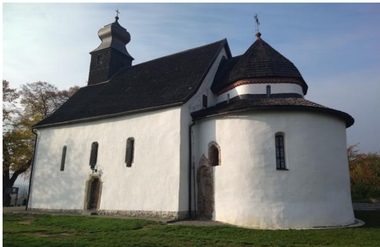
Рис. 1. Горянська ротонда (церква Святої Анни)

В Україні, зокрема в Горянах, вперше зустрічаємося з сюжетом «Дари волхвів» у тій трактовці, яка згодом твердо увійде в українське мистецтво. До Марії, яка невимушено сидить з дитиною на руках, підносять дари. Хлопчик з чисто дитячою безпосередністю одною ручкою ухопився за руку матері, а другу простягнув до дарів. Хоч одяг й зображений без світлотіньової ліпки, рисунок правдиво пов'язаний з позами, з поворотами і жестами фігур. Загальний колорит фресок, завдяки тонкій гармонії білих, вохристо-рожевих, золотистих, сіро-зелених та сіро-синіх Тонів, напрочуд гарний.