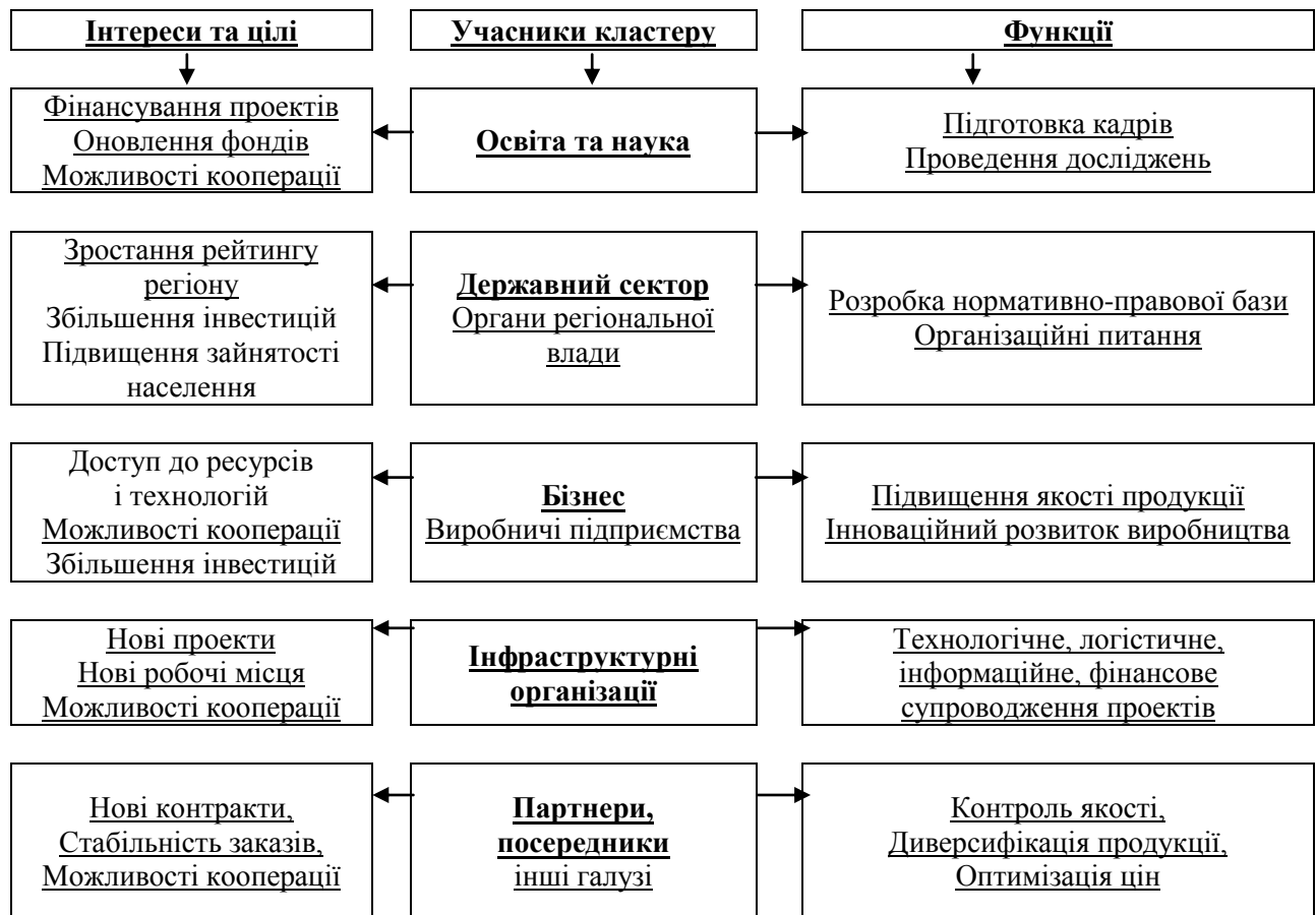
Рис. 1 – Взаємозв'язок та інтереси учасників кластеру

Виробничий галузевий кластер – це поєднання підприємств основного виробництва з підприємствами по виробництву: сировини і матеріалів; основного і допоміжного обладнання; надання послуг із транспортування, складування і збереження; сервісних послуг в сферах дослідження ринку, підготовки кваліфікованих кадрів. Кластеризація може стати основою розвитку галузі