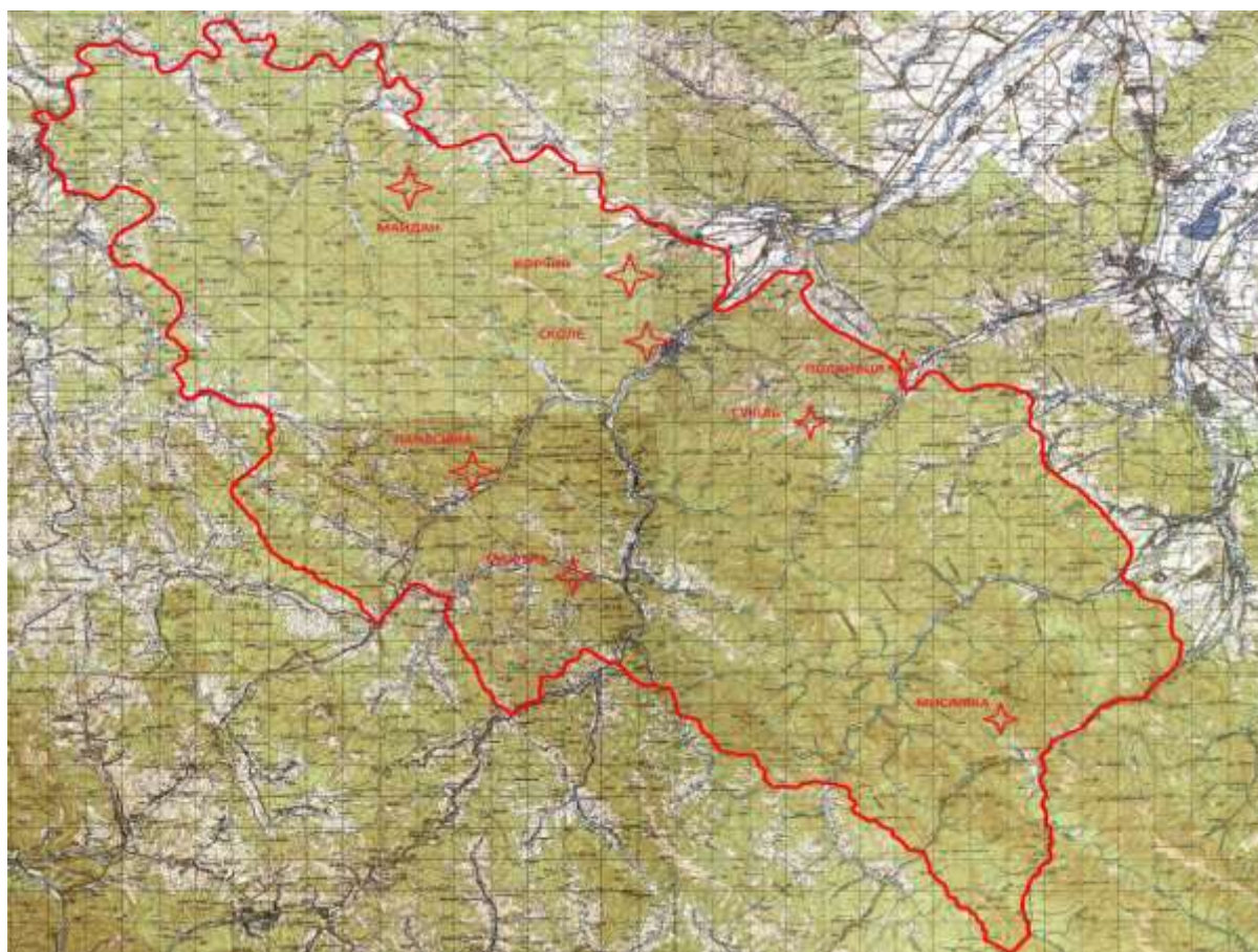
Рис.2 – Локалізація трансект на території Сколівських Бескид.

На цих трансектах проведено маршрутні дослідження з визначенням потужності підстилki та гумусового горизонту ґрунтів для встановлення впливу орографічних особливостей території на запаси органічного вуглецю. Відібрано зразки для визначення вмісту органічного вуглецю. Трансекти охоплюють повний спектр експозицій, діапазон висот над рівнем моря (650 м – 1294 м), лісові екосистеми з різними за породним складом, структурою та віком деревостанами.