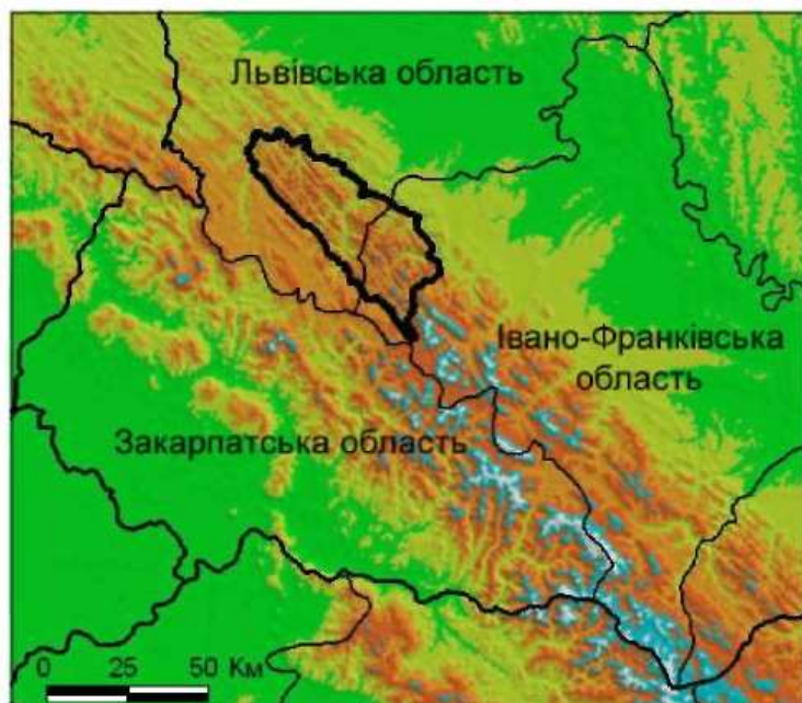
Рис.1 – Локалізація території дослідження – Сколівські Бескиди

ким чином, площа лісів, придатних для інтенсивної експлуатації, становить 29 % площі всіх лісів Сколівських Бескидів, або 17 % площі екорегіону. Серед лісів, придатних для інтенсивної експлуатації, найбільші площі займають похідні буково-(ялицево)-ялинові деревостани (17 048 га) стрімких схилів, великі масиви яких зосереджені на південному сході регіону у басейні верхів'я р. Мізунки. На північному заході Сколівських Бескидів невеликі осередки лісів можливої інтенсивної експлуатації розташовані на вершинах невисоких хребтів та спадистих схилах, це переважно вторинні буково-ялицеві та чисті ялинові деревостани.