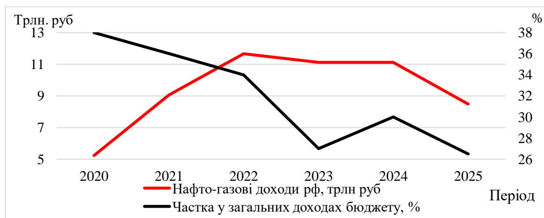
Рис. 2. Динаміка змінення нафтогазових доходів рф та їх частки у загальних доходах бюджету

У квітні 2025 року доходи росії від експорту нафти впали до 13,2 млрд доларів – це другий найнижчий рівень з моменту введення енергетичних санкцій. Середня ціна бареля російської нафти другий місяць поспіль залишалася нижче 60 доларів, що пов'язано з тенденціями на світовому ринку та рішеннями країн ОПЕК+. Якщо така ситуація триватиме, зовнішні рахунки росії можуть зазнати значного тиску. У січні-квітні 2025 року доходи бюджету від нафти і газу зменшилися на 10% порівняно з аналогічним періодом 2024 року. Динаміку нафтогазових доходів рф та їх частку у загальних доходах бюджету наведено на рис. 2.