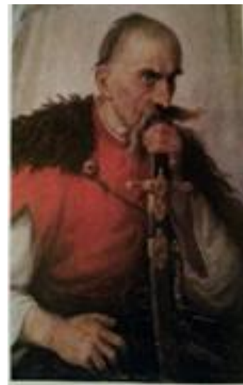
Рис. 3. Запорожець

У 1910-х роках А. Монастирський створив ряд живописних робіт, присвячених життю народу. З-поміж них найкращі «Селянські типи» – портрети селян, в образах яких немов закарбувались сліди бідняцького життя: передчасна старість, страждання, невеселі думки. Ці роботи близькі до народних портретів П. Мартновича, творчість якого дуже цінував і добре знав А. Монастирський. А. Монастирський завжди високо цінував характерний типаж, пильно придивлявся до людей, з якими зводила його доля. У жадобі пошуків нових вражень він часто бував у гуці народних мас, там і народився задум його прославленого «Паламаря». У 1932 р. він створив портрет-картину «Запорожець» (рис. 3), що став результатом глибокого зацікавлення художника історичним минулим України. Гостро індивідуальний і водночас переконливий типовий образ козака став яскравою алегорією лицарської доблесті та мужності народу, що протягом століть не раз виявляв їх визвольних битвах.