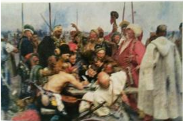
Рис. 2. Запорожці пишуть листа турецькому султану.

На виставці разом з картиною «Запорожці» (рис. 2), було експоновано тридцять етюдів до неї.