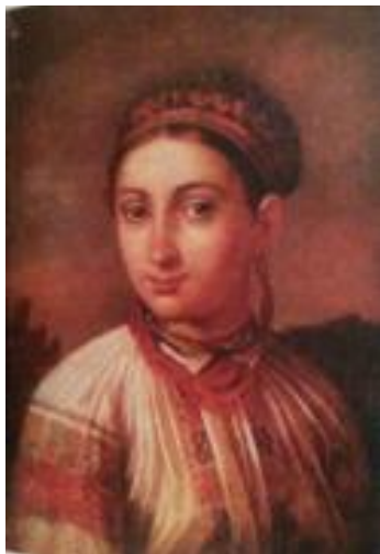
Рис. 2. Дівчина з Поділля

При побіжному погляді може здатися, що на портретах зображена одна особа або принаймні рідні сестри. Та в дійсності жодного стереотипу в доборі портретованих Тропінін не припускався. Довершений овал обличчя, гладенько розчесані на проділ коси, оливковий відтінок шкіри, кароокість і чорнобровість, гладеньке чоло, помірно розвинені уста – сполученням цих типових для українок Правобережжя рис Тропінін домагався різновидів зовнішності і характерності. Але лише констатація етнічної своєрідності не створила б такого образу, якби митець не підкреслив романтичного серпанку у своїх героїнях: в їх нелукавих довірливих поглядах, щирих сором'язливих посмішках, прикрашених разками намиста.