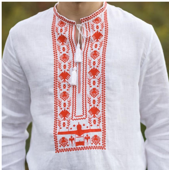
Рис. 2. Орнамент вишиванки з «Байрактаром»