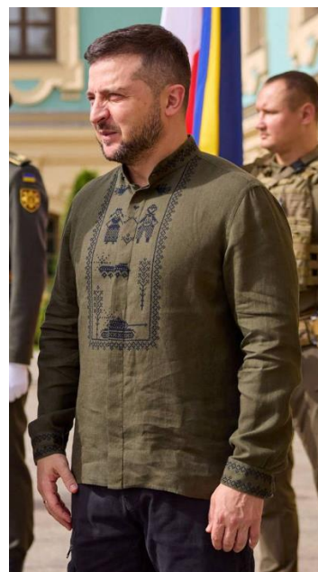
Рис. 1. Вишиванка в мілітарному стилі від бренду Indposhiv

Іншими різновидами новітньої мілітарної вишиванки є зразки орнаментів, у малюнок яких графічно включено зброю (іноземних зразків), якою Україна ефективно воює проти ворога. Як ми можемо розуміти, це найбільш дієва і, відповідно, максимально символічно означена зброя, яка, за переконанням пересічних українців, наділена надзвичайними, навіть подекуди міфологізованими якостями в боротьбі з російськими військами, – це безпілотники «Байрактар», ракетні комплекси «Хаймарс», переносні ракетні комплекси «Джавелін». Загалом майстрині народної вишивки досить неоднозначно висловлюють своє потрактування таких візерунків, з огляду