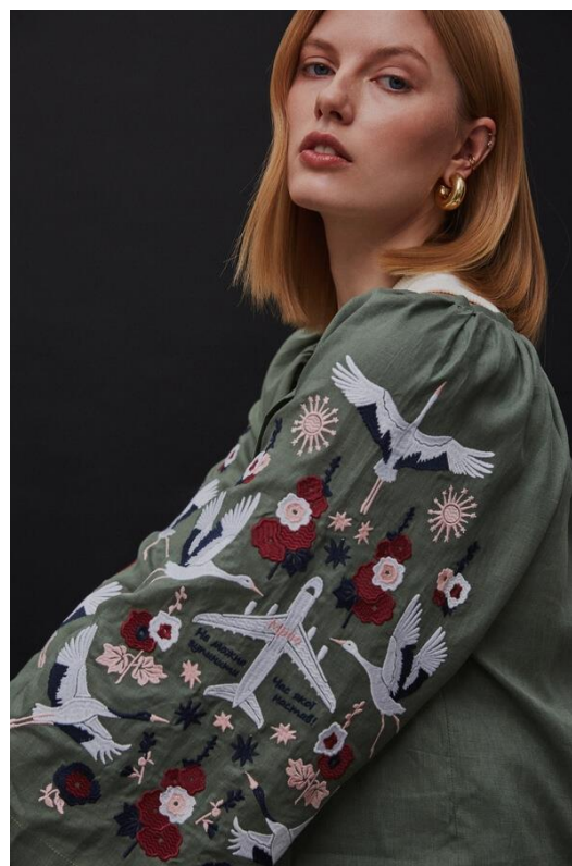
Рис. 5. Вишиванка «Мрія» («Вільні люди»)

Загалом варто також зазначити, що традиція поєднання елементів військової символіки з традиційною українською, не є новою. Зокрема, дослідники відзначають, що «здавна вважалося, що орнаментика забезпечує оберегову та захисну функцію, тому символічним є використання традиційних