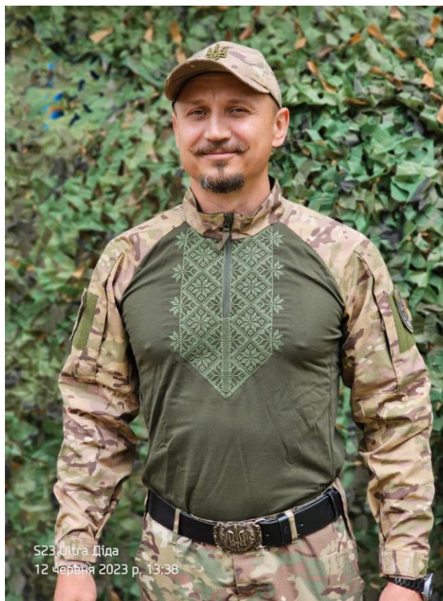
Рис. 6. Військова вишита сорочка від «ВишивУбакс»

Отже, ми бачимо, що сучасні нехудожні об'єкти, стилістика та колірна гама яких закодовані в орнаментах вишиванки, спричинили формування феномену мілітарної вишиванки, що ґрунтується на потребі суспільства у відображенні в традиційному одязі новітніх сенсів і символів доби.