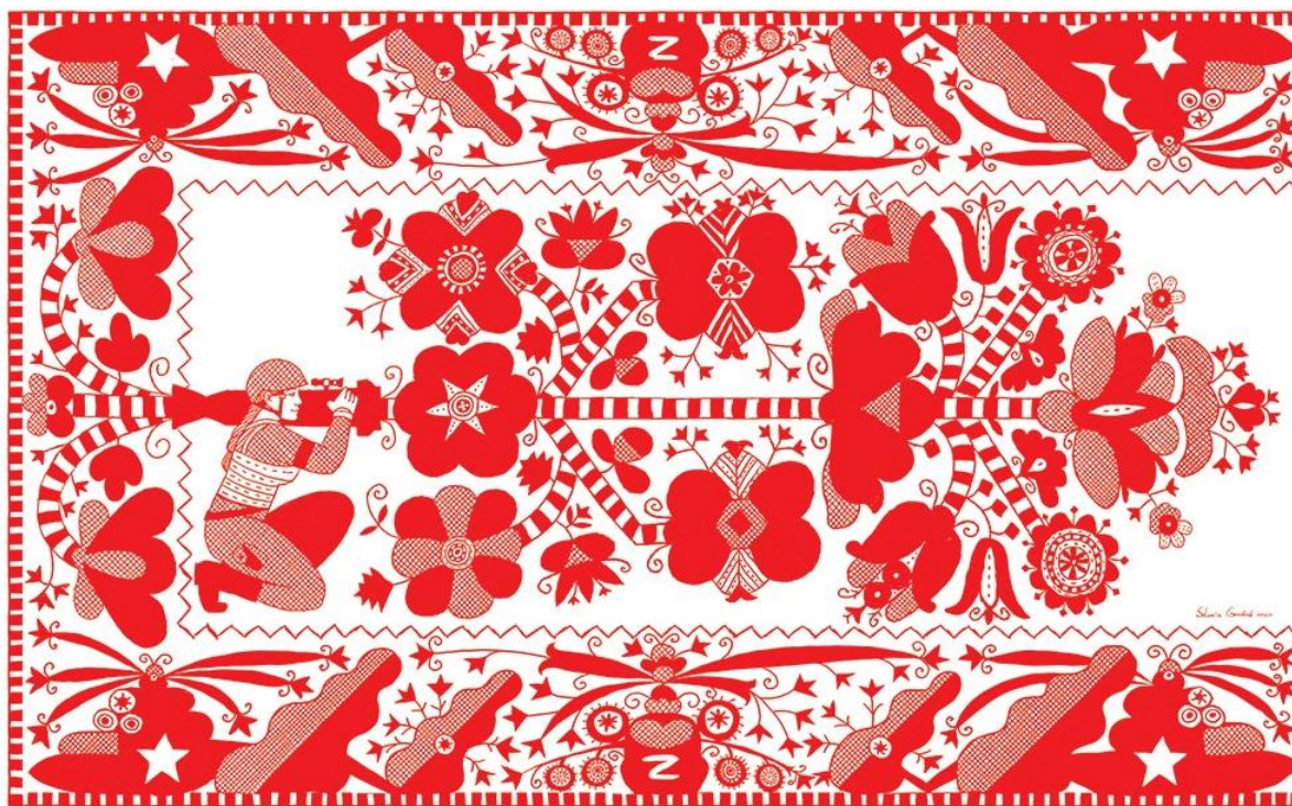
Рис. 4. Орнамент рушника С. Гороб'юк «Джавелін»

Іншою темою для сучасних мілітарних вишиванок, пов'язаною з війною, стала вишиванка бренду «Вільні люди» [3], присвячена втраченому українському літаку «Мрія», який був зруйнований у Гостомелі на початку повномасштабного вторгнення. Вишиванка сіро-оливкового кольору обіч на рукавах містить зображення літака «Мрія» в стилізованому орнаменті з квітів, сонця, зірок та журавлів і вплетений слоган «Не можна зупинити Мрію, час якої настав», де, власне, обіграно назву самого літака. Це також досить нове художнє рішення та символічне кодування об'єктів сучасного походження, що мають стосунок до воєнних дій.