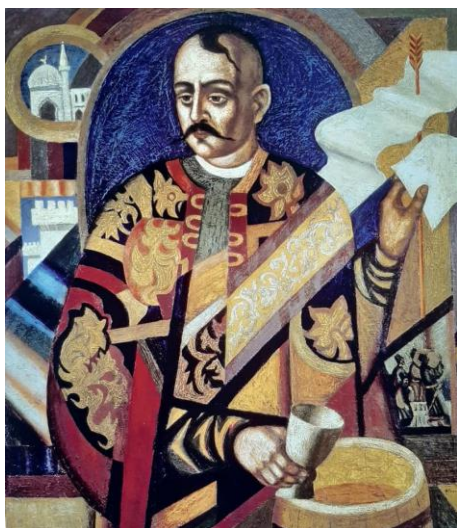
Рис. 4. «Байда Вишневецький», 1991

Основними творами на історичну тематику є відомі картини митця: «Вірність Україні» (1972), «Гетьман Дорошенко» (1975), «Гонта і Залізняк» (1976), «Гайдамаки» (1979), «Гетсиманська молитва» (1981), «Маруся Чурай» (1986), «Портрет гетьмана Сагайдачного» (1991), «Кобзар Вересай» (1994), «Мазепа і Карл XII» (1995), «Галшка Гулевичівна» (1997).