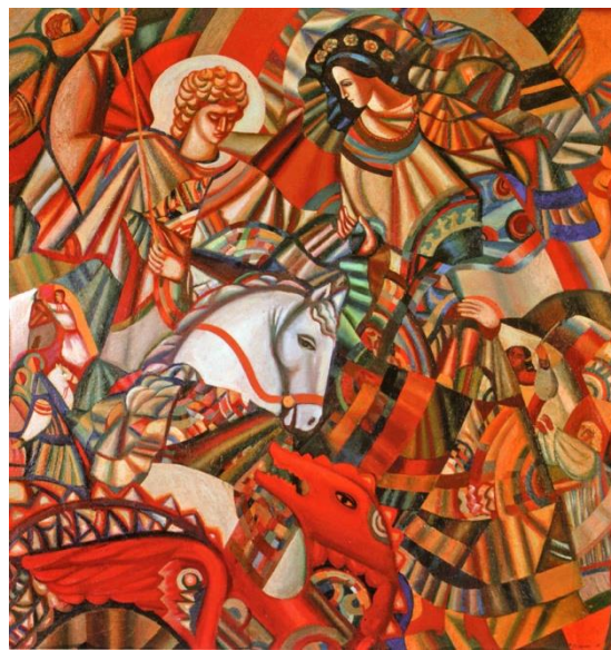
Рис. 1. «Змієборець (Святий Юрій)», 1978, н.о.

висушеній рибині, яке було оберегом чумаків під час походів. До 200-ліття Т. Шевченка (2014 р.) він створив понад 40 ілюстрацій до «Кобзаря».