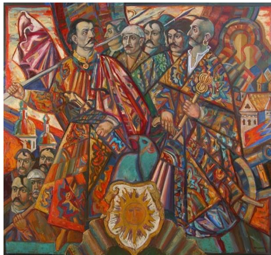
Рис. 5. «Гонта і Залізняк»

Основними творами на історичну тематику є відомі картини митця: «Вірність Україні» (1972), «Гетьман Дорошенко» (1975), «Гонта і Залізняк» (1976), «Гайдамаки» (1979), «Гетсиманська молитва» (1981), «Маруся Чурай» (1986), «Портрет гетьмана Сагайдачного» (1991), «Кобзар Вересай» (1994), «Мазепа і Карл XII» (1995), «Галшка Гулевичівна» (1997).