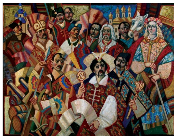
Рис. 6 «Ще покриють Україну червоні жупани», 1991

Полотна Ф.Гуменюка складно сплутати з іншими, - в його картинах вдало сполучаються традиційна українська символіка та сучасні засади малярства, а поєднання традицій та авангардних віянь надають його творам особливої самобутності.