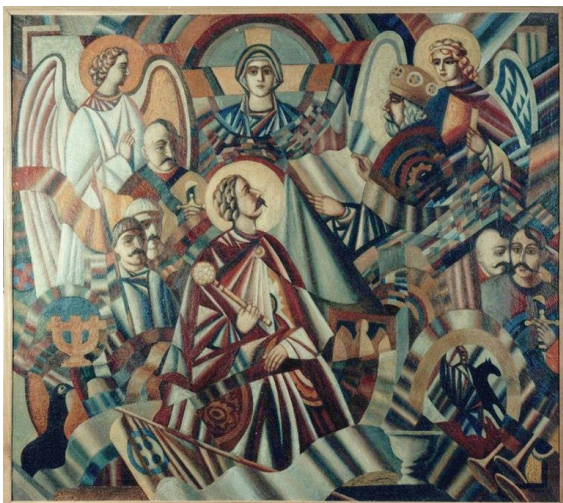
Рис. 3. «Посвячення в гетьмани»

НАОМА. Ф. Гуменюк є активним учасником як персональних, так і групових виставок у різних країнах світу, які відбулися, зокрема, в Торонто, Вінніпегу, Оттаві, Гамільтоні (Канада), Нью-Йорку (США), Духцові (Чехословаччина), Єревані (Вірменія), Баку (Азербайджан), Парижі (Франція) [4]. У 1988 році виставку Ф. Гуменюка експонували в залах Національного архіву Канади в Оттаві, в Українському музеї в Нью-Йорку. Там же, познайомившись з місцевою українською інтелігенцією, художник зміг ближче побачити життя діаспори та зафіксувати її на полотні. «Великдень у Торонто» — одна з композицій «канадського» періоду. Пізніше була участь у виставці робіт українських художників в Гранд-Пале, у Парижі; персональна виставка у Національному художньому музеї в Києві, де була представлена ціла галерея гетьманів, і присудження в 1993 році Національної премії імені Тараса Шевченка в галузі образотворчого мистецтва [14].