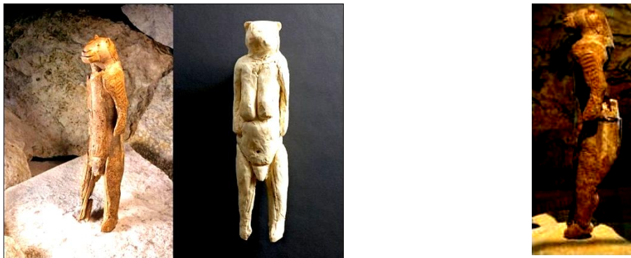
Рис. 1. Реконструкція скульптурки жінки-левиці з печери Штадель (Холенштайн. Німеччина). 38 – 34, 6 тис. р. до н.е.

На наш погляд, найбільш обґрунтованою є точка зору, згідно з якою териантропи є відбитком універсальних релігійних ідей про походження роду від якоїсь природної істоти. З переходом від первісного стада до родоплемянної общини і зміцненням родинних зв'язків зростало прагнення одноплемінників зрозуміти таємницю походження свого роду. Оскільки палеолітична людина, хоч й виокремлювала себе серед тварин, але жила у найтіснішому контакті зі світом природи, своїми предками вона вважала природні істоти, з якими пов'язувались її уявлення про могутність, верховенство, ієрархію. Виникнення тотемних уявлень первісних людей про походження роду від якоїсь природної істоти обумовили зародження у художньо-релігійній практиці образу териантропа. Характерним прикладом є скульптурка жінки-левиці (висота 29,6 см), яка датується 34,6 тисяч років до н. е., або 38 тисяч р. до н. е. з масиву Холенштайн (Hohlenstein), розташованого на плато Швабський Альб (рис.1).