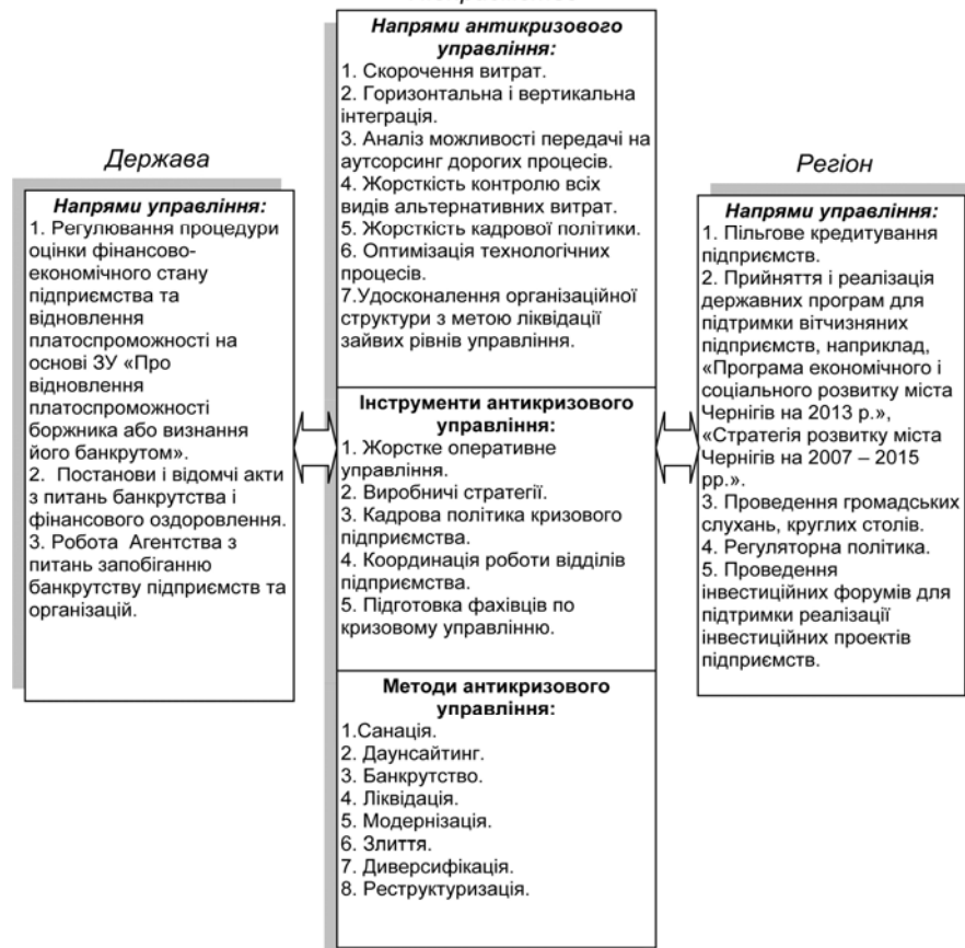
Рис. 2. Діюча система антикризового управління

Управління кризовим станом підприємств на сучасному етапі розвитку економіки України здійснюється на трьох рівнях: державному, регіональному, на рівні підприємств [1, 3, 4] (рис. 2).