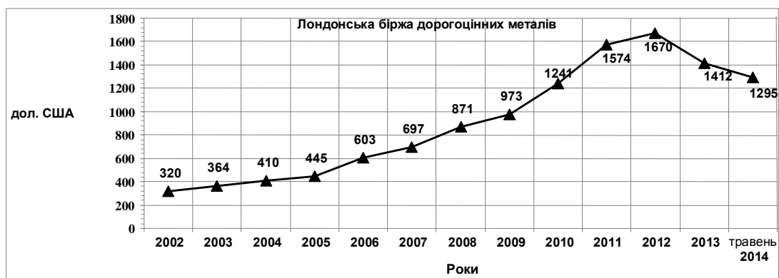
Рис. 1. Динаміка середньорічних цін на золото (за 1 тройську унцію) на Лондонській біржі дорогоцінних металів за період 2002-2013 рр. та окремо на 20.05.2014 р., у доларах США

Джерело: побудовано автором на основі [1]