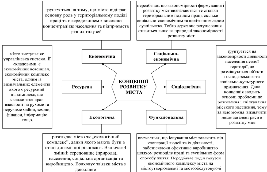
Рис. 1. Основні концепції розвитку міст

міста на містоутворювальні та містообслуговуючі галузі, що виконують різні завдання в комплексі міст, не дає змоги зрозуміти природу насамперед великих міст та мегаполісів.