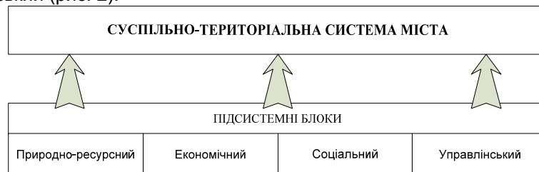
Рис. 2. Підсистемні блоки суспільно-територіальної системи міста

Аналіз передумов розвитку міста як складної цілісної системи передбачає дослідження структурних елементів системи міста в статичній та динамічній формі. При цьому слід зазначити, що елементи структури суспільно-територіальної системи міста об'єднуються в декілька тісно взаємозв'язаних підсистемних блоків [17]: природно-ресурсний, соціальний, економічний (господарський) та управлінський (рис. 2).