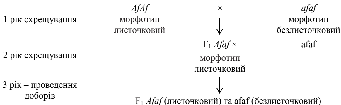
Рисунок 1. Схема складної гібридизації гороху.

Більш ретельно проводять добори у F 1 з комбінацій за схемою (F 1 (A × B) × B), де в якості батьківських компонентів (A чи B) один із зразків був листочкового типу, а інші – безлисточкового (вусатого). У такому разі за умови спрямованості добору на отримання рослин безлисточкового типу рослини такого типу добирають для селекційного розсадника, а решту пересівають для подальшого добору (рис. 1). Таким же чином з подібних комбінацій добирають рослини за наявністю ознаки стійкості до обсипання (ген df ), довжини стебла (ген le ) та у випадках, коли бажана ознака обумовлюється детермінується моногенно.