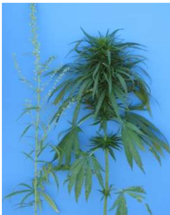
Fig. 2. Male and Female Plants

According to different theories of hemp sex genetics, there are from 5 sexual types of monoecious plants (Neuer, Sengbusch, 1943) to 22 sexual types of masculinized and feminized plants (N.N. Grishko, 1940). According to an improved classification, 12 sexual types of dioecious and monoecious hemp are considered (N.D. Migal, 1992) [10]. Male hemp plants are the main destabilizer of monoecious hemp populations (Fig. 2). Therefore, during the propagation of a variety to the 2 nd reproduction (certified seeds), the number of such plants is limited to 1% by the international standard EU.