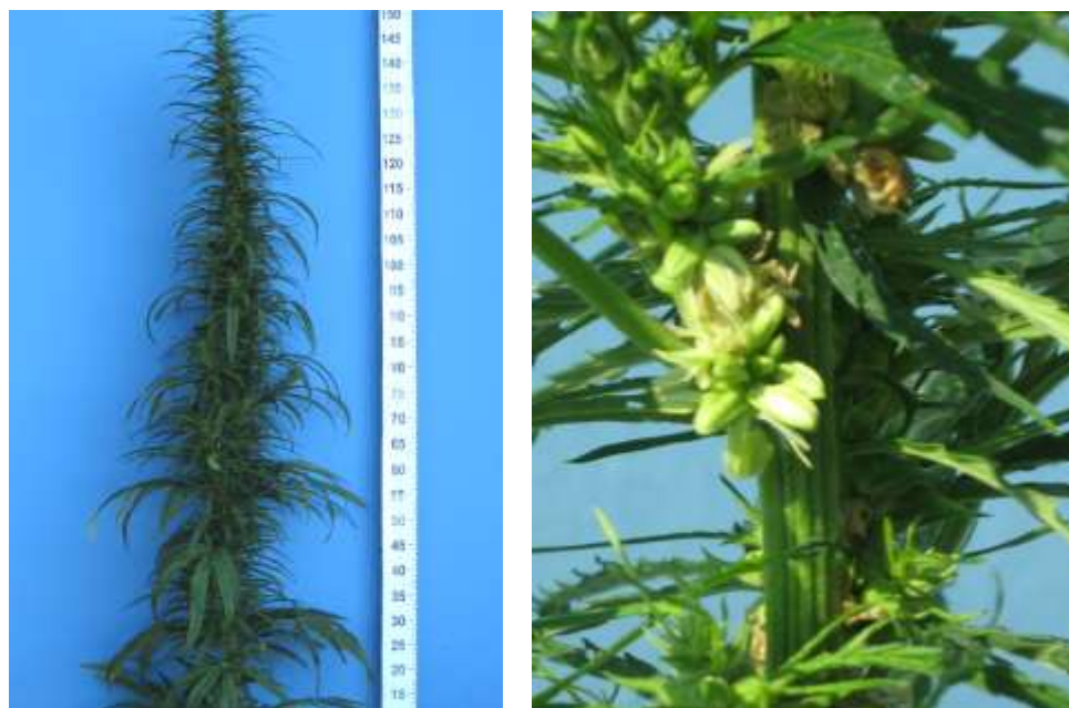
Fig. 3. A Monoecious Feminized Female plant and an Inflorescence Fragment

tions with such plants decreases segregation into undesirable sex types, including non-productive masculinized plants and late-ripening feminized male plants (Fig. 3).