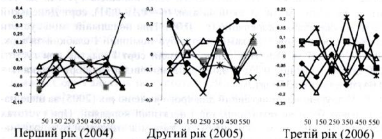
Рисунок 1. Зміна коефіцієнтів кореляції між парами кількісних ознак ярого ячменю в тріадному модулі в залежності від ценотичної ситуації (норма висіву) і років дослідження, 2004-2006

Примітка. \blacklozenge - Донецький 14, \blacksquare - Донецький 12, \blacktriangle - Донецький 15, \times - Прерія, * - Галактик