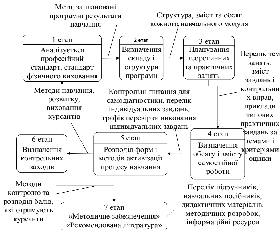
Рис. 2. Послідовність етапів проектування навчальної та робочої програми з навчальної дисципліни

При розробці програм необхідно дотриматися загальних принципів, правил і порядку проектування [4], а також може бути корисною така послідовність етапів (рис. 2).