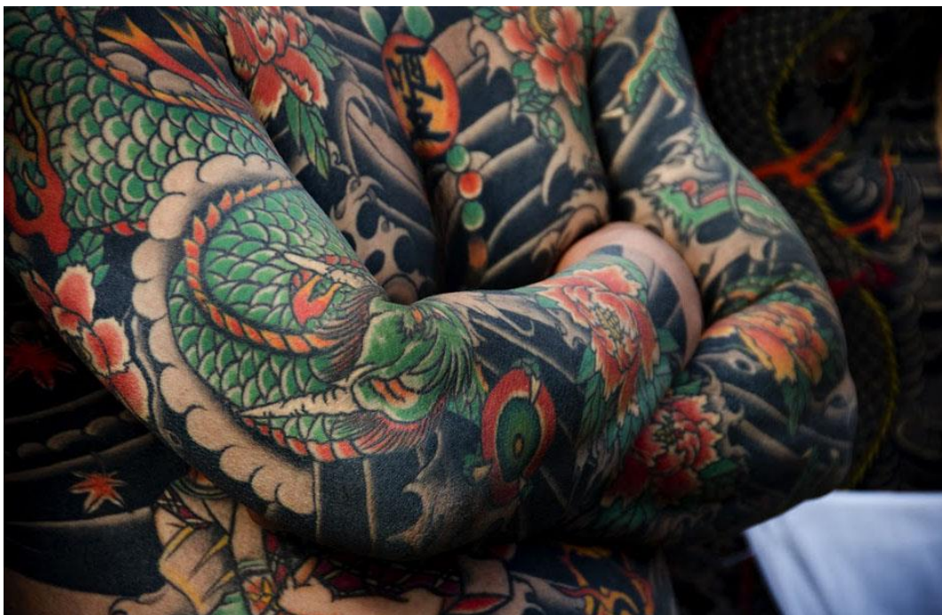
Рис. 2. Татуювання Якудза. Насичені фарби, присутня світлотінь та досконала композиція

кисті рук і обличчя. Члени організації ретельно носять одяг, яке прикриває все татуювання і тільки «свої» можуть споглядати дане мистецтво (рис. 2).