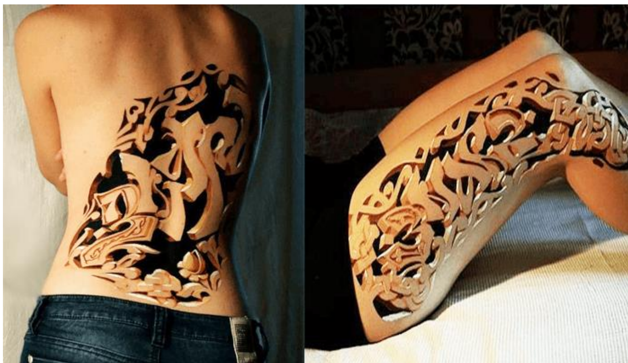
Рис. 3 Реалістичне виконане з застосуванням гри світла, тіней та принципів ергономіки

Новий патріотичний стиль українського тату [10].