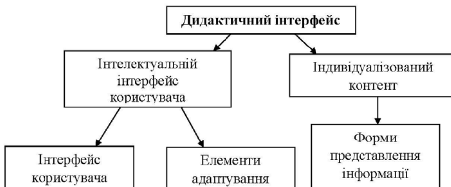
Рис. 1. Зміст поняття «дидактичний інтерфейс»

Зміст поняття «дидактичний інтерфейс» пропонується візуалізувати у вигляді схеми (рис 1.)