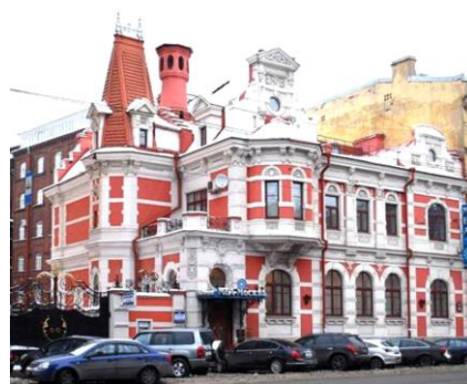
Рис. 10. Особняк К.Б. Зигеля в Санкт-Петербурге, 1888 – 1890 гг. [26]

Многие сохранившиеся промышленные здания «кирпичного стиля» весьма успешно приспособляются под функции музеев и культурно-развлекательных центров [4]. Например, бывшее здание декорационных складов и мастерских в Санкт-Петербурге было превращено в современный концертный зал (рис. 11).