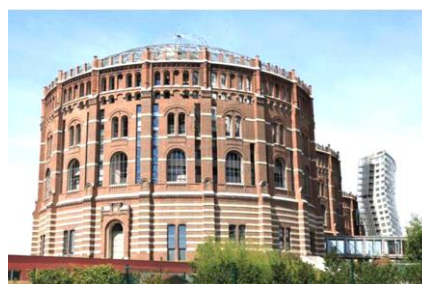
Рис. 1. Аллея газгольдеров в Вене. Современная реконструкция [12]

Первыми сооружениями в «кирпичном стиле» были промышленные здания: газгольдеры (рис. 1) и многоэтажные здания пакгаузов, строившиеся по берегам Лондонских и Гамбургских доков в 1880-е–1890-е гг. В 1883 г. в порту Гамбурга из красного кирпича с применением стилизованных элементов готики и ренессанса был построен «складской город» – Шпайхерштадт [12, 16].