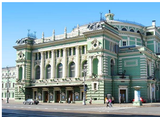
Рис. 5. Здание Мариинского театра в Санкт-Петербурге. Было построено по проекту А. К. Кавоса в 1859–1860 гг. на месте театра-цирка. В 1894–1896 годах было значительно реконструировано по проекту В. А. Шрётера [20]

В 1890-е гг. по проектам Виктора Шрётера были построены такие импозантные здания как дом Н. Второва в Иркутске (рис. 6) и церковь Святого преподобного Сергия Радонежского в Бад-Киссингене, выполненная в нео-византийском стиле (рис. 7).