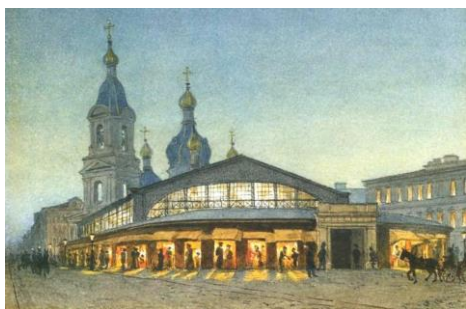
Рис. 8. Здания рынка на Сенной площади в Санкт-Петербурге с перекрытиями из металлических конструкций, 1883 – 1885 гг. (разобраны в 1939 г.) [24]

12. Доходный дом на 13-й линии Васильевского острова, д. № 20 (1898 г.);