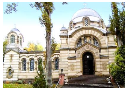
Рис. 7. Церковь Святого преподобного Сергия Радонежского в Бад-Киссингене в неовизантийском стиле. Арх. В.А. Шрётер, 1890-е гг. [22]