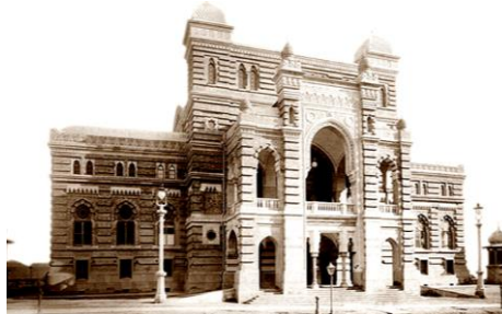
Рис. 4. Оперный театр в Тифлисе (Тбилиси). Арх. В. А. Шрётер, 1872 г. [19]