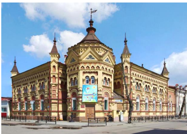
Рис. 6. Дом Н. Второва в Иркутске. Арх. В.А. Шрётер, 1897 г. [21]