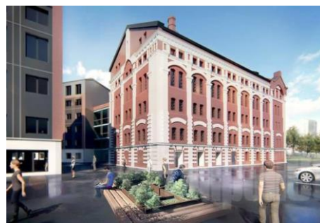
Рис. 12. Проект приспособления здания промышленной мельницы под современный IT-центр в Харькове на ул. Ю. Чигирина [28]

В г. Харькове в последнее время появился проект приспособления под функции современного IT-центра бывшего здания промышленной мельницы в районе Харьковской набережной (рис. 12).