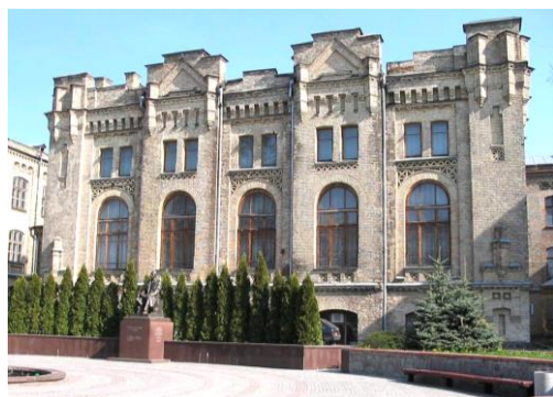
Рис. 9. Корпуса Киевского политехнического института (1898 – 1901 гг.) [25]