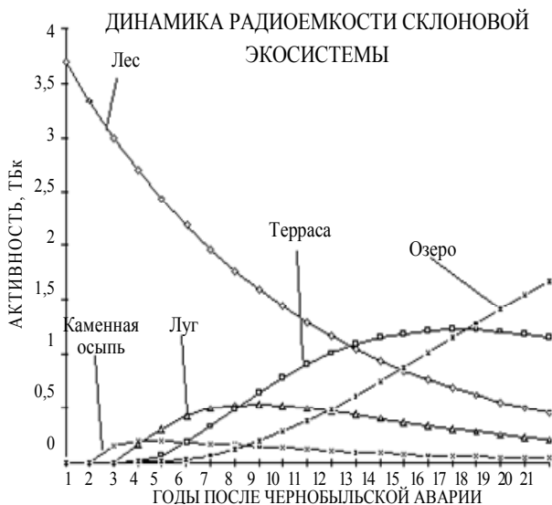
Рис. 2. Динамика перераспределения радионуклидов 137 Cs в типовой склоновой экосистеме

Результаты моделирования динамики перераспределения радионуклидов в склоновой экосистеме представлены на рис. 2.