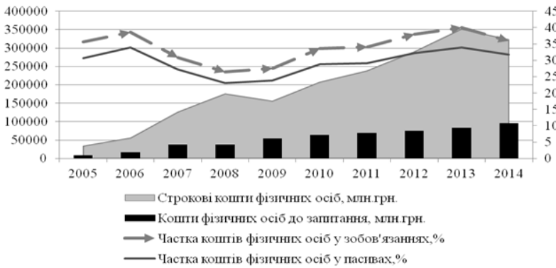
Рис. 2. Динаміка коштів фізичних осіб у банках України за 2005–2014 рр. (складено автором на основі використання матеріалів [8])

Процес формування депозитної політики банків повинен визначатися концептуальними положеннями її реалізації (рис. 3).