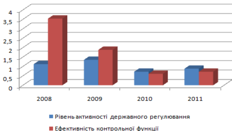
Рис. 1. Зіставлення абсолютних значень рівня активності державного регулювання ринку фінансових послуг України та ефективності контрольної функції

На рис. 2 подано характер відповідності динаміки зростання ВВП та зміни рівня розвитку ринку фінансових послуг.