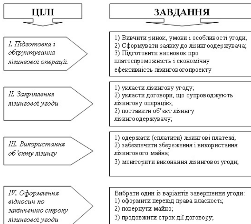
Рис. 2. Цілі і завдання механізму здійснення лізингової операції