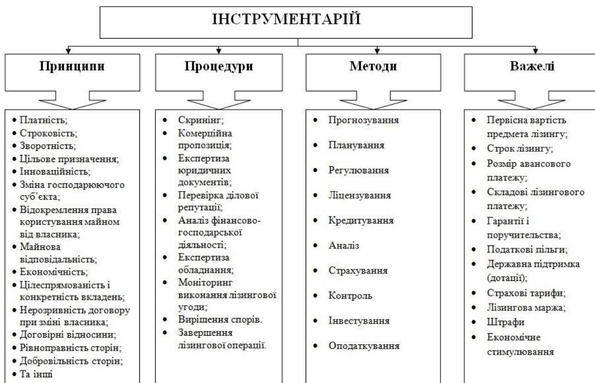
Рис. 5. Інструментарій механізму здійснення лізингових операцій.

Таким чином, важлива роль при здійсненні лізингових операцій належить розробці ефективного механізму їх здійснення. Даний механізм являє собою функціональну складову системи, в межах якої суб'єкт приймає рішення щодо об'єкту лізингу, враховуючи при цьому мету, цілі, завдання лізингової операції. Особливе значення мають функції, що їх виконують суб'єкт і об'єкт лізингу по відношенню один до одного.