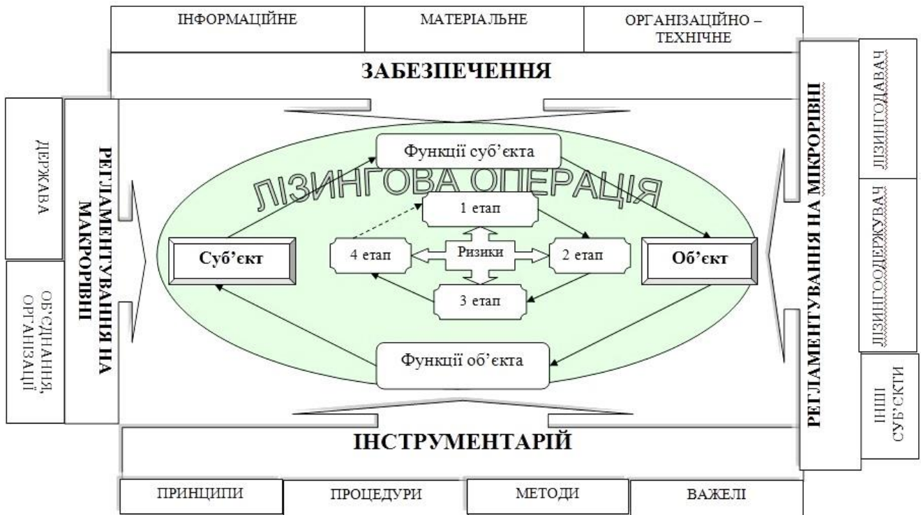
Рис. 1. Механізм лізингових операцій

очікуваного ефекту від лізингової операції для кожного із її учасників. У той же час, зважаючи на процесний характер лізингової операції, варто визначити перелік цілей на кожному із етапів, що у кінцевому підсумку дозволять досягнути поставленої мети. У свою чергу варто відмітити, що разом із обґрунтуванням цілей необхідно визначити конкретні завдання, вирішення котрих забезпечить досягнення вказаних цілей (рис. 2).