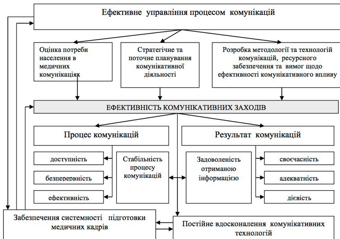
Рис.3. Модель забезпечення ефективності комунікацій в охороні здоров'я

З метою прийнятності запропонованих інновацій було проведено їх експертне оцінювання. Експертами виступило 17 науковців із яких 6 докторів та 11 кандидатів наук та 13 організаторів охорони здоров'я вищої кваліфікаційної категорії. 86,7 % експертів позитивно оцінили всі запропоновані інновації. При цьому 26,7 % експертів мали зауваження до створення галузевої комплексної програми комунікацій в охороні здоров'я та визначення чітких управлінських вертикалей та горизонталей управління комунікаціями в охороні здоров'я, 16,7 % мали зауваження до створення системи підготовки медичних працівників до комунікативної діяльності.