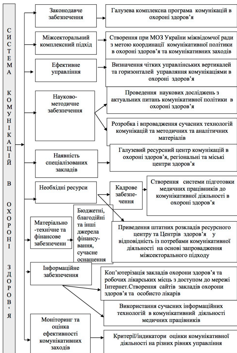
Рис. 1. Складові системи комунікацій в охороні здоров'я

Будь-яка система здатна ефективно працювати лише в тому випадку, коли всі її ланки узгоджені, є професійні виконавці, забезпечена цілісність, наступність етапів, послідовність та логічність. Тобто, система має бути технологічною. Комунікації в системі охорони здоров'я проводяться на різних рівнях управління – від центрального до місцевого, а надання медичної допомоги – від первинної ланки до спеціалізованої допомоги. Пріоритетом при реформуванні системи охорони здоров'я є первинний рівень на засадах сімейної медицини. В такому разі основні функції щодо забезпечення комунікативних заходів медичного характеру мають покладатись на лікарів загальної практики – сімейних лікарів. Однак підготовки сімейних лікарів для комунікативної діяльності не проводиться, через її відсутність в переліку навчальних дисциплін. Основи комунікативної діяльності студентам-медикам взагалі не викладаються. До того ж, у нормативних документах та інструкціях не визначені обов'язки медичних працівників щодо здійснення комунікацій, що унеможливило здійснення контролю за цим напрямком діяльності.