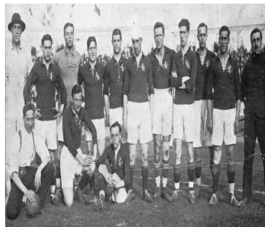
Рис. 3. «Пічічі» в складі національної команди Іспанії з футболу на Олімпійських іграх 1920 р.

Зокрема, після Олімпійських ігор Рафаель отримує