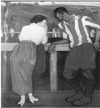
Рис. 5. «Пічічі» в кольорах «Атлетіка» з Більбао, залицяється до красуні (подібної на його дружину Авеліну).

Estadístiques de Futbol. BDFutbol, 2024; Diario online líder en información deportiva, 2024). Найкращий голкіпер отримав «Трофео Самора» на честь Рікардо Самори, а найкращий бомбардир – «Трофей Пічічі» (Dades Històriques i Estadístiques de Futbol. BDFutbol, 2024; Diario online líder en información deportiva, 2024).