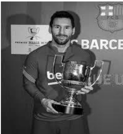
Рис. 6. Ліонель Мессі з восьмим Трофеєм «Пічічі» (2020 р.).

На теперішній час рекордсменом за кількістю здобутих Трофеїв «Пічічі» є Ліонель Мессі, який здобував дану відзнаку 8 разів (рис. 6) (Мессі отримав рекордний трофей «Пічічі» та поскаржився на поразку від Реала, 2020; Diario online líder en información deportiva, 2024).