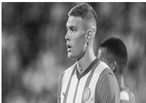
Рис. 10. Володар «трофею Пічічі» 2024 року Артем Довбик.

По одному представнику у футбольних клубів: «Реал Ов'єдо», «Ельче», «Гранада», «Реал» Хіхон, «Спортінг» Хіхон, «Тенеріфе», «Расінг», «Депортиво», «Вільярреал», «Мальорка», «Бетіс», «Сарагоса» та «Жирона» (LALIGA official website, 2024; Diario online líder en información deportiva, 2024).