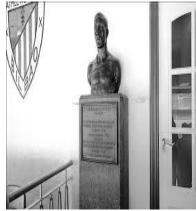
Рис. 7. Погруддя «Пічічі» на «Сан-Мамесі» Більбао.

У 1929 році на «Сан-Мамесі» (Більбао) – «Пічічі» встановили пам'ятник, а кожен капітан команди, яка вперше прибуває на стадіон має покласти до нього квіти. Це погруддя вшановує пам'ять гравця, який 21 серпня 1913 року забив перший гол на одному з найстаріших стадіонів Іспанії (рис. 7) (За його прізвисько билися Довбик, Серлот та Беллінгем. Хто такий Пічічі, 2024; Athletic Club, 2024).