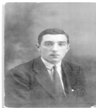
Рис. 4. Рафаель Морено Арансادی під час суддівської кар'єри

Завчасно у віці 29 років «Пічічі» завершує футбольну кар'єру (в основному через травми) та стає арбітром (рис. 4) (Яким був перший культовий форвард Іспанії, 2020).