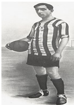
Рис. 1. Рафаель Морено Арансادی – «Пічічі».

ворота суперників (Яким був перший культовий форвард Іспанії, 2020; За його прізвисько билися Довбик, Серлот та Беллінгем. Хто такий Пічічі, 2024).