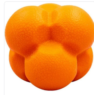
Рис. 1. Реакційний м'яч

Педагогічний експеримент полягав у доповненні змісту тренувального процесу експериментальної групи вправами з реакційними м'ячами (рис 1.), спрямованими на покращення сенсомоторних реакцій. Реакційний м'яч це функціональний прилад, який завдяки своїй особливій конструкції (на м'ячі шість однакових опуклостей) ідеально вписується в руку, легко в неї лягає і не випадає. Реакційний м'яч – це м'яч із незвичайною горбистою поверхнею, завдяки чому він відскакує від стін і підлоги в непередбачуваних напрямках. Завдання гравця встигнути зорієнтуватися і зловити його. Завдяки своїм характеристикам цей м'яч дає можливість широко використовувати його у тренувальному процесі, включати у вправи, спрямовані на розвиток сенсомоторних реакцій. Педагогічний експеримент тривав 4 місяці.