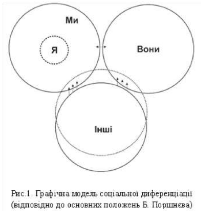
Рис.1. Графічна модель соціальної диференціації (відповідно до основних положень Б. Поршнева)