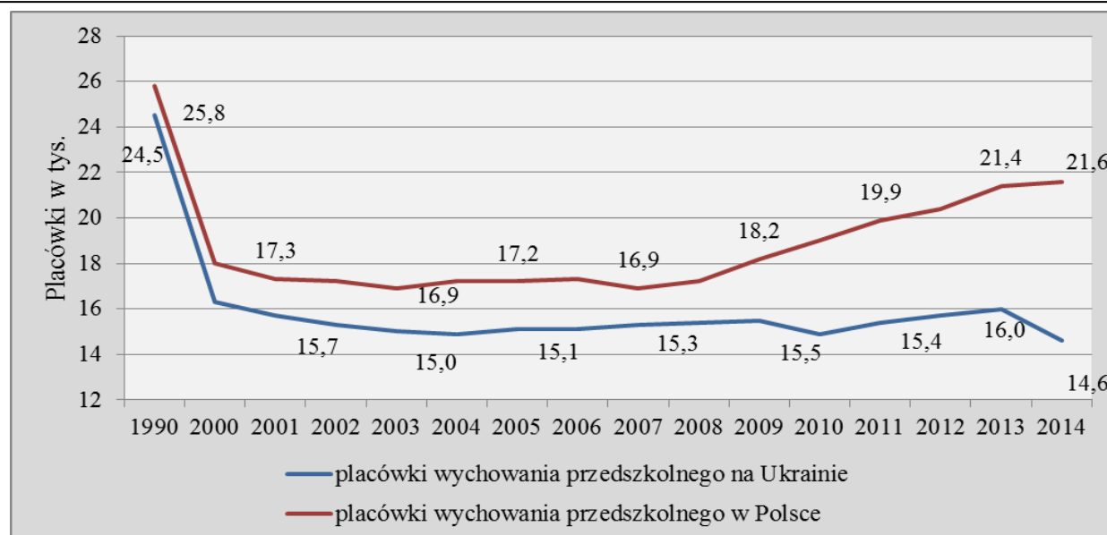
Wykres 1. Liczba placówek wychowania przedszkolnego na Ukrainie i w Polsce w roku 1990 i w latach 2000-2015. Źródło: Opracowanie własne na podstawie danych statystycznych [14, 24, 25]