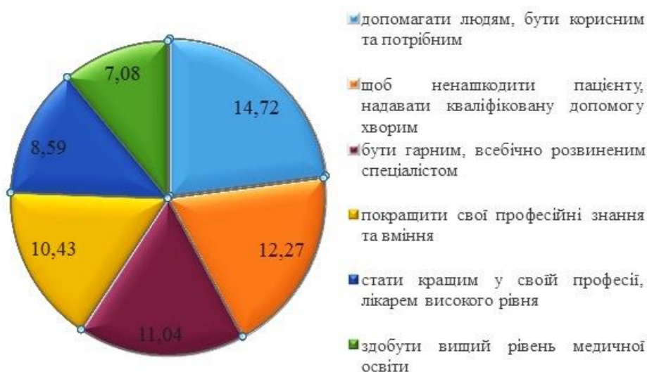
Рис. 4. Мотиваційні стимули до професійного самовдосконалення

– здобути вищий рівень медичної освіти – 7,98 % (13 ос.).