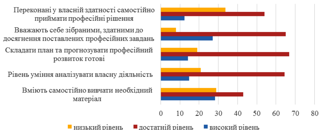
Рис. 2. Показники готовності до професійного самовдосконалення майбутніх молодших спеціалістів з медичною освітою

Переконані у власній здатності самостійно приймати професійні рішення 12,27 % (20 ос.) – на високому, 53,99 % (88 ос.) – на достатньому та 33,74 % (55 ос.) – низькому рівнях (рис. 2).