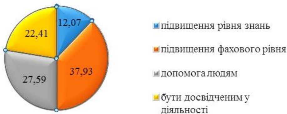
Рис. 1. Мотивація до професійного самовдосконалення у практикуючих медсестер

Результат дослідження мотиваційної сфери професійного самовдосконалення відображено на рис. 1.