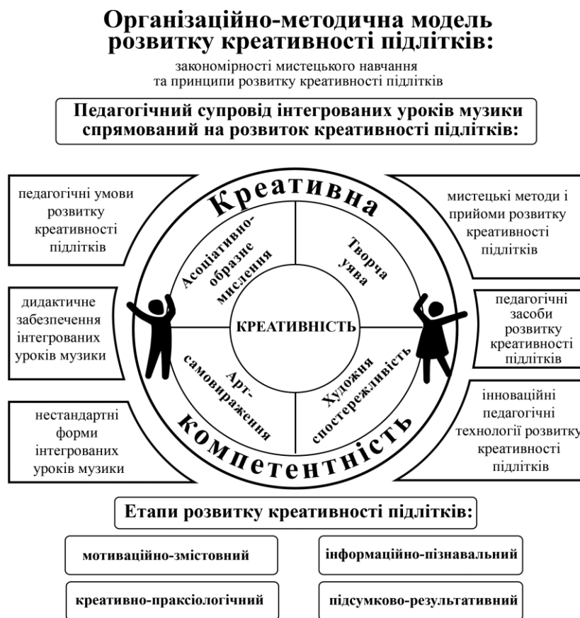
Рис.1. Організаційно-методична модель розвитку креативності підлітків на інтегрованих уроках музики

гогічним засобом вирішення проблеми креативного розвитку особистості учнів-підлітків на інтегрованих уроках музики в практиці загальної шкільної освіти. Візуалізація змісту організаційно-методичної моделі розвитку креативності підлітків на інтегрованих уроках музики представлена на рис. 1.